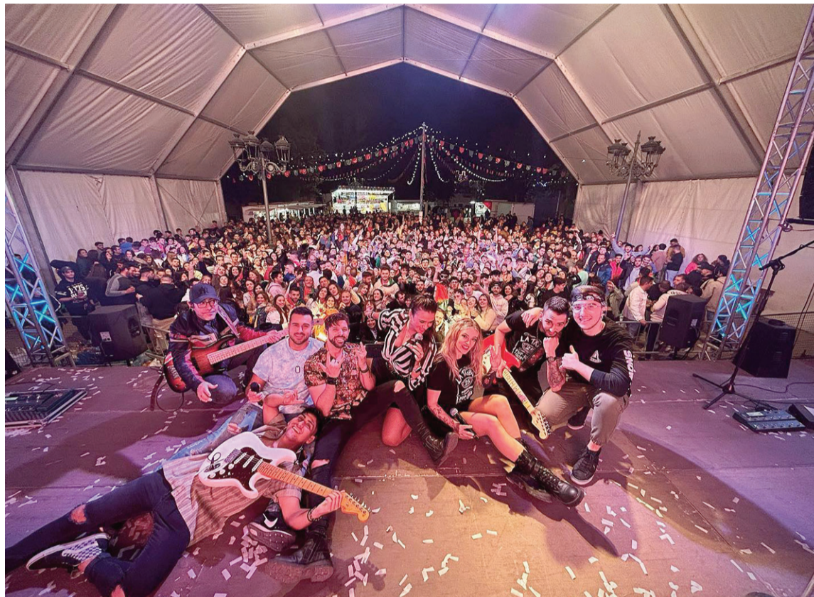
Orquesta, en una de las actuaciones de la gira de este verano.