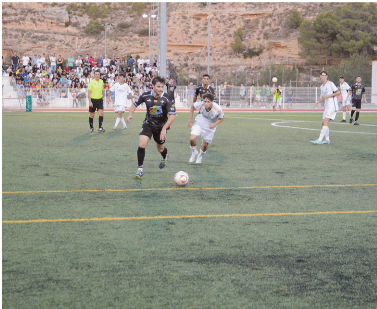
Partido del Alcañiz CF contra el Juvenil del Real Madrid, el 30 de agosto

En cuanto al fútbol sala, el Intersala jugará contra el Caspe este jueves, a partir de las 19:30 horas. El Translop Alcañiz Club Pa-