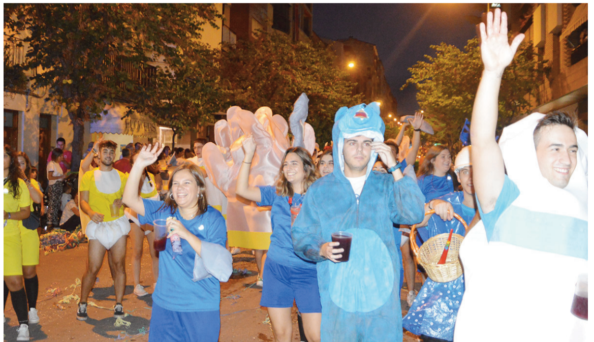
Desfile de carrozas en la avenida de Aragón, en una imagen de archivo

Para el público familiar se han programado mañanas de gigantes y cabezudos en el entorno de la plaza de España, y espacios infantiles con castillos hinchables en La Glorieta por las tardes en los que varios días habrá actividades complementarias. De esta