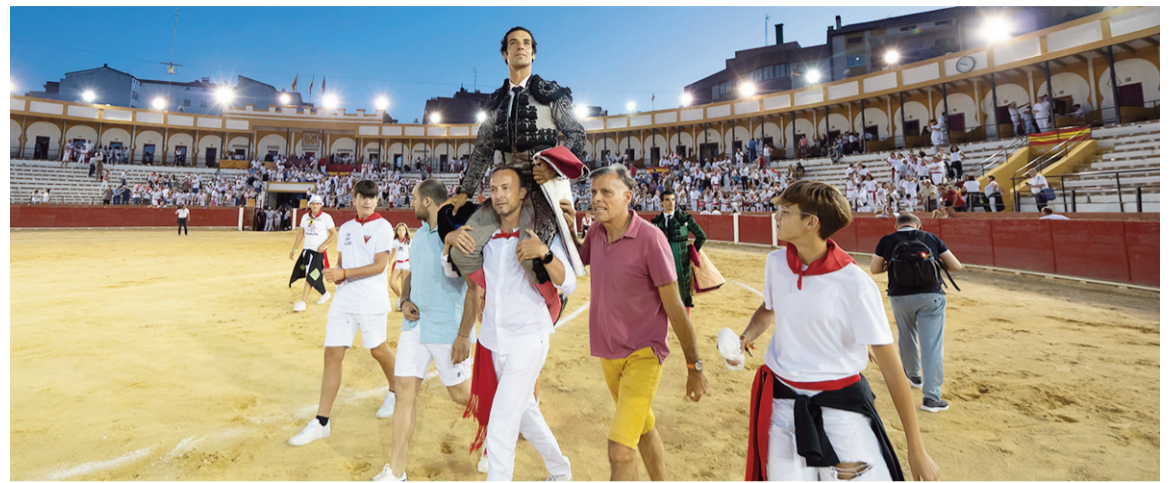
Morenito de Aranda abrió la puerta grande en Teruel durante la última Vaquilla. Antonio García

“Estamos acostumbrados a ver mucho cartel de toreros, pero luego baja mucho el toro. Vengo de lidiar tres festejos en Calanda donde la presentación ha sido impecable. Eso es posible porque los toreros que han venido han tenido cierta exigencia, pero no han tenido todo el poder. El año pasado Alcañiz tuvo un cartel intachable (Cayetano Rivera, Ginés Marín y Ángel Téllez), pero los toros eran de un tamaño reducido. Nosotros queremos traer toros y toreros, que la lucha esté muy equilibrada”, argumenta el empresario bajoaragonés, con ganadería propia, que se llevó la licitación con puntuación de cien sobre cien en el pliego.