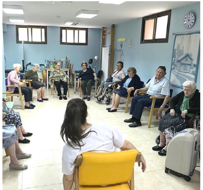
Los ancianos de la residencia durante la realización de una actividad

También, en Virgen del Olmo saben que las familias son una pieza importante para el desarrollo del día a día de los residentes. Es por esto que tienen acceso libre, según reconocen, para tranquilidad de los residentes y transparencia hacia los amigos y las familias. Esa transparencia la trasladan a los informes que realizan mensualmente de los internos para los familiares y amigos. Lo más importante para Virgen del Olmo es que los residentes tengan la mejor vida posible.