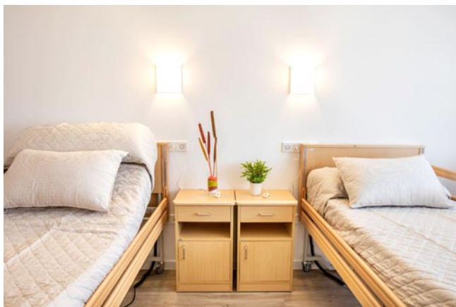
Las habitaciones para personas asistidas disponibles en San Hermenegildo

Además del servicio residencial hay un centro de día con transporte propio para recoger y devolver a los mayores a sus hogares. La modalidad de horario es de diez a una del mediodía o de diez a seis de la tarde. Realizan tareas de terapia ocupacional y se incluyen tres sesiones de fisioterapia para todos los usuarios