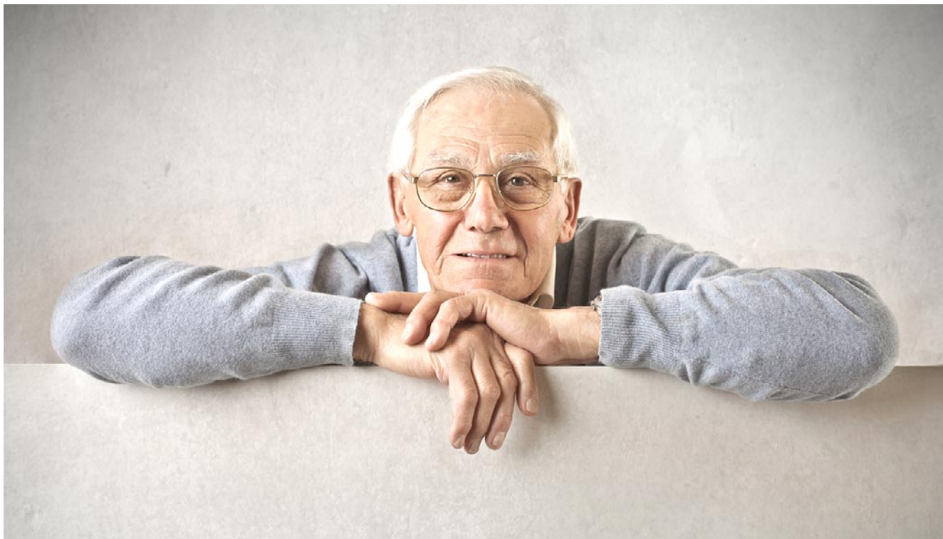
Las personas mayores pueden recurrir a los servicios de ayuda a domicilio o acompañamiento en ingresos de hospital ofrecidos por Auxidomicilio

ne bien cuidada”, cuando toca movilizar en el despertar o para salir a la calle o los trabajos domésticos como limpieza o hacer la compra. Todas ellas tienen un nexo en común que es el acompañamiento y evitar que se apodere de los mayores ese sentimiento de soledad.