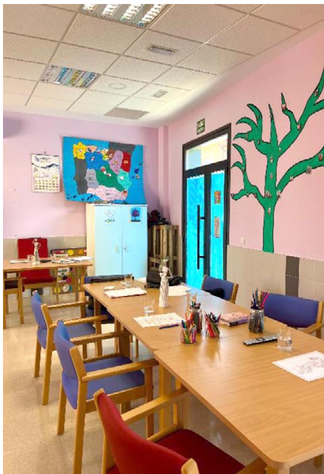
El espacio en el que realizan actividades como puede ser pintar

Estas son algunas de las cosas que ofrece la residencia de Martín del Río y que se complementan ahora con las ofrecidas en el centro de día de Utrillas. Si algo define a ambos espacios es el constante trabajo para adaptarse y ofrecer lo mejor a todos los residentes. Y es que ambos espacios son una oportunidad para no dejar de ver por la ventana el municipio en el que siempre han vivido o estar más cerca de casa. Al final, es seguir cuidándose con la familia creada en sus pueblos.