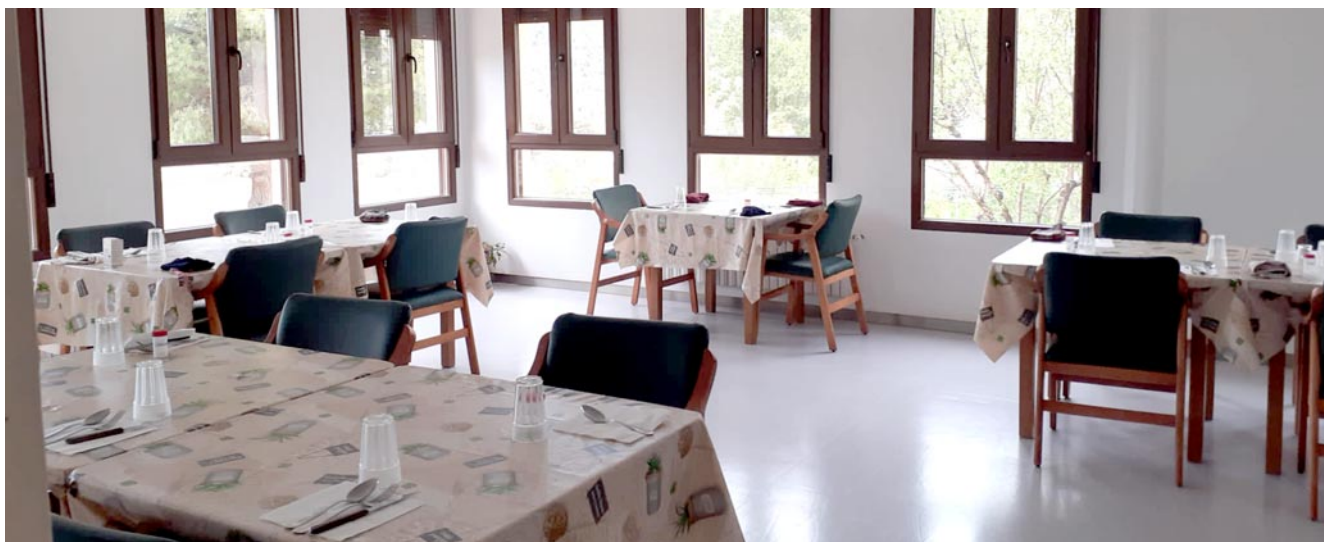
El espacio utilizado para que los residentes o aquellos que vienen de fuera puedan comer en la residencia de Noguerauelas

sar. Pero por la tardanza en el tiempo se han salido porque como reconocen son dos años y es un “tiempo largo” en el que pasan muchas cosas.