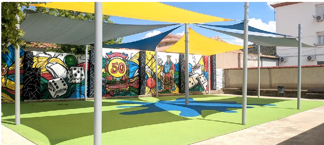
El sistema de protección solar y el suelo de caucho que se han instalado en el patio del Hogar de mayores de Andorra para las actividades físicas

temperatura, tamiza la luz, protege de la lluvia y el viento, lo que hace que se cree un ambiente único y agradable para hacer actividad física.