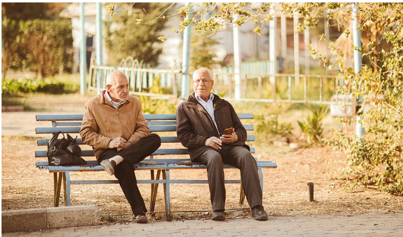
Dos adultos de edad avanzada compartiendo su tiempo en el banco de un parque con el objetivo de disminuir ese sentimiento de soledad