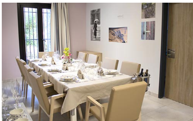
Uno de los espacios comedores disponibles en el centro de Vitalia

Vitalia ofrece a todas las personas, también independientes a sus centros, servicio de rehabilitación centrado en daño cerebral, neurodegenerativo y osteo-articular. Un equipo de profesionales utiliza la tecnología y terapia más avanzada para mejorar la calidad de vida de los residentes y pacientes