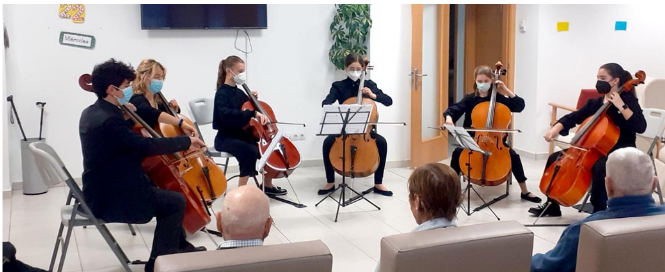
Varios usuarios del centro de día de la capital del Bajo Aragón disfrutando de una de las actividades culturales como es un concierto de música

la funcionalidad de los usuarios y dar apoyo a los familiares con un horizonte claro, prolongar la calidad de vida, procurando herramientas para una permanencia adecuada en su entorno familiar habitual.