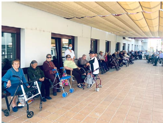
Los residentes de Rey Ardid de Calamocha en el patio exterior

Además de estos programas, trabajan en muchos otros y es que la Fundación Rey Ardid y todo su equipo son el acompañamiento de todos estos residentes. Con el modelo de atención personalizada buscan lo mejor para ellos. Porque el objetivo es que aquello que les define sea lo que marque la estancia en las residencias de la Fundación Rey Ardid.