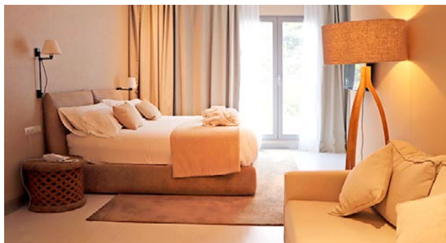
La habitación de hotel en la que descansar durante la estancia