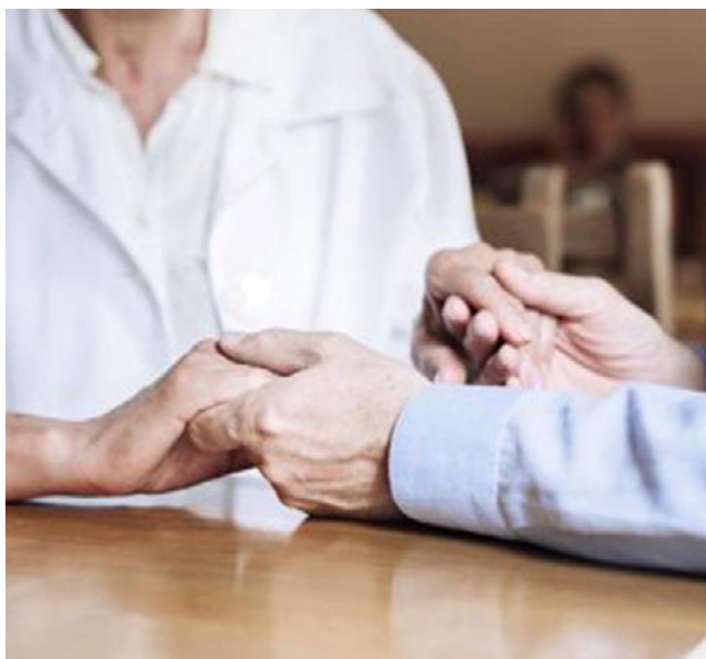
La unión de manos que simboliza el acompañamiento con los mayores

SE HA CREADO UN GLOSARIO QUE BUSCA ELIMINAR TODAS ESAS PALABRAS Y EXPRESIONES ESTIGMATIZANTES SOBRE LA DISCRIMINACIÓN A LOS MAYORES