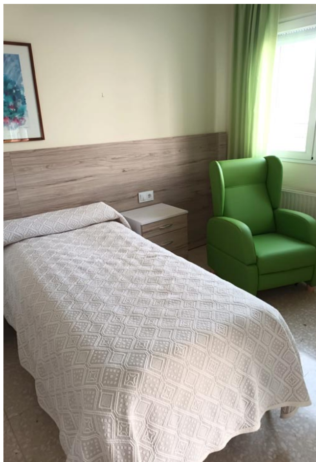
El interior de una de las 36 habitaciones que se han reformado

La Residencia Guadalupe de Mas de las Matas es ya un referente en la zona y es por esto que hay vecinos de pueblos próximos que están en lista de espera. Tanto los que recién entran como los que ya están tienen a su alcance una de las residencias más renovadas.