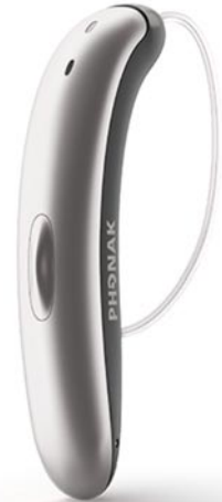
El modelo de audífono Phonak Slim disponible en Opticalia

Opticalia Teruel lleva acompañando durante muchos años a los turolenses y desde el centro esperan que así siga. Y quieren recordar que siempre estarán ahí para acompañarlos en su salud visual y auditiva por la que trabajan cada día para dar siempre las mejores opciones disponibles en el mercado.