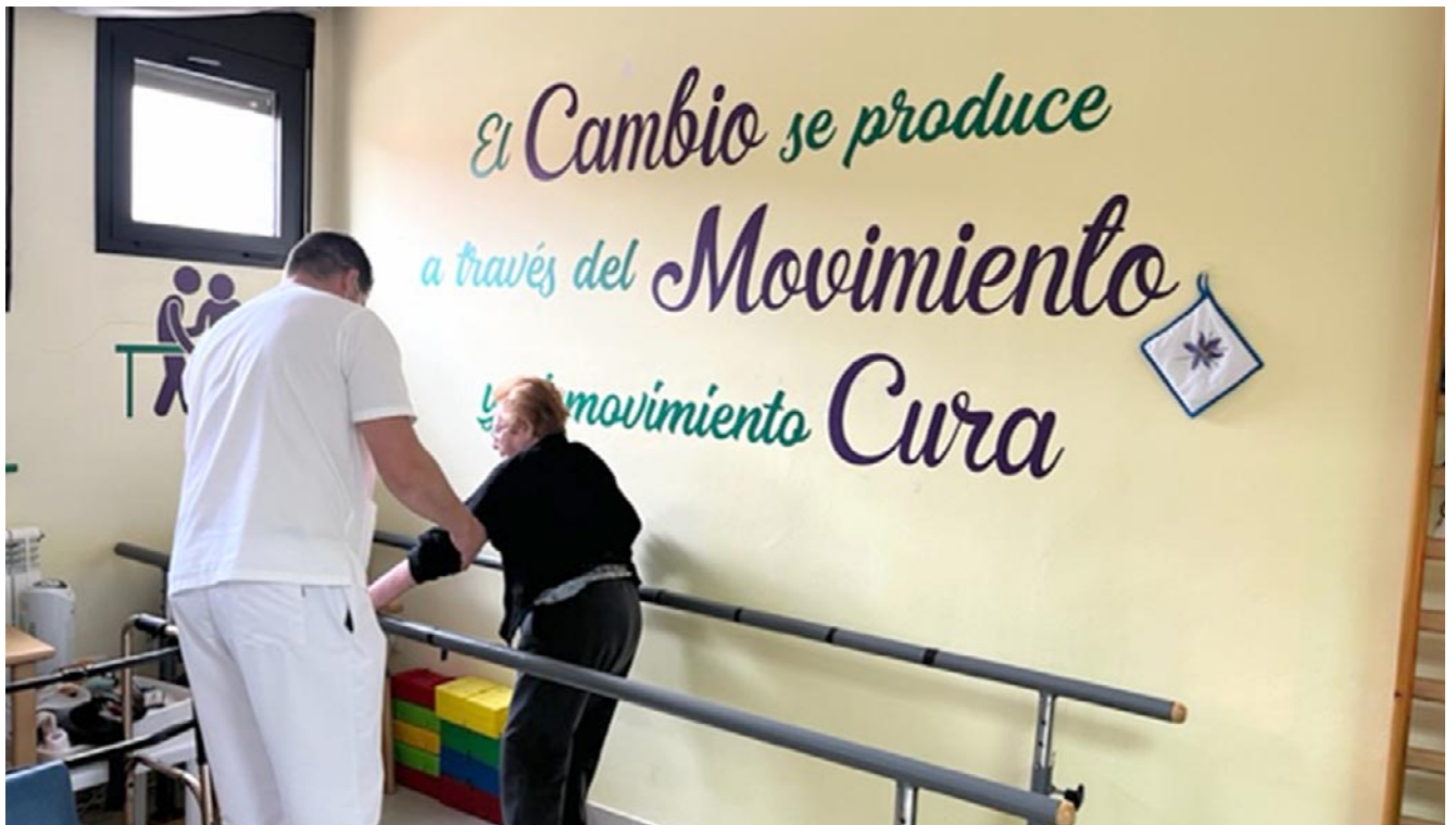
Sesión de rehabilitación centrada en la movilidad a una de las residentes del centro San José de Monreal del Campo

ven los hitos que consiguen los residentes se les “saltan las lágrimas”. Porque en el espacio San José el espíritu de familiaridad y acompañamiento es lo que llena los pasillos.