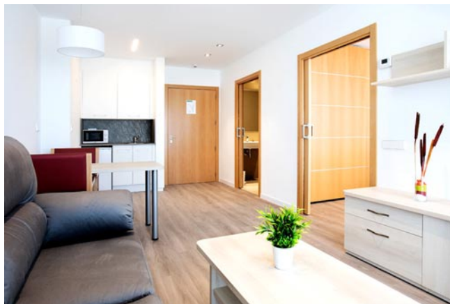
El interior de los apartamentos disponibles en el complejo San Hermenegildo

Así que, San Hermenegildo es ese centro en el que hay espacio para todos, pero sobre todo para los gustos e historias de los residentes porque la atención personalizada es su base.