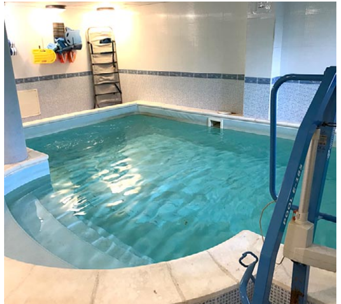
La piscina adaptada de la Residencia Virgen de los Olmos de Calamocha