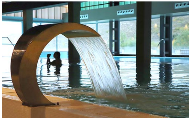
Parte del espacio termal en el que relajarse con numerosos circuitos