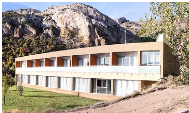
El exterior del Hotel Balneario de Segura de Baños rodeado de naturaleza

De alargar la estancia son muchas las opciones de rutas para vivir 100% la naturaleza como es el parque geológico de Aliaga. Si se busca algo más tranquilo quedan los museos y exposiciones de Dinópolis en Ariño o la del calzado en Brea. A la vuelta queda tiempo para darse un baño en las piscinas, un masaje o degustar esa gastronomía típica de la zona.