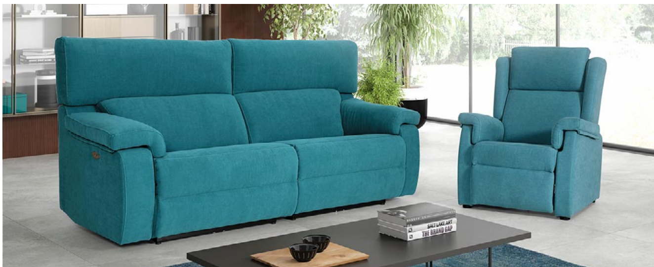
Ejemplo de Sofá Boom de Tapigrama apto para mayores al tener el fondo reducido y los asientos y reposabrazos elevados

recerá “la acción de sentarse y levantarse” dado que las piernas formarán un ángulo recto que evita forzar los músculos y articulaciones. Los apoyabrazos también deberán colocarse en una posición superior y servirán de apoyo para el momento de reincorporarse. El relleno es igual de importante y deberá ser “firme” con gomaespuma de alta densidad.