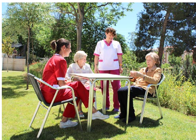
Residentes junto al equipo de trabajo comparten tiempo en el jardín

La asistencia permanente, enfermería, farmacia, podología, psicología y terapia ocupaciones son otros de los servicios disponibles para las cerca de 170 personas que llenan el centro Vitalia Paules y el resto de espacios de este grupo. Para ellos el residente lo es todo y para poder verlo se puede reservar cita para una visita en cualquiera de sus centros en Teruel. Como ellos dicen el 90% de las familias que los visitan eligen Vitalia para dejar a su cargo el cuidado de sus mayores. Si se busca la innovación y lo novedoso con el trato personal y cercano Vitalia es el sitio para hacerlo realidad porque los residentes disfrutarán de todas las mejoras posibles pero sin perder la esencia de lo de siempre.