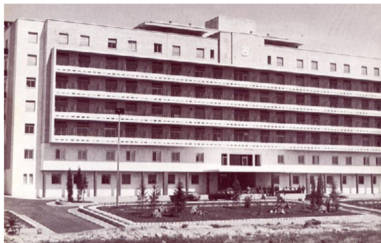
Residencia Sanitaria San Jorge Huesca 1965-1967