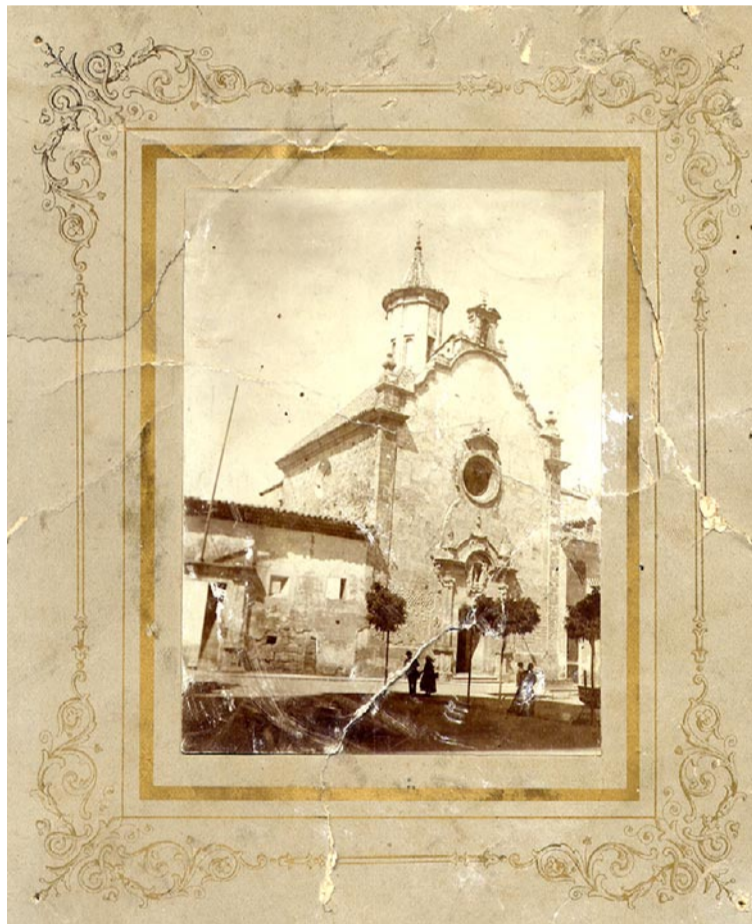
Iglesia del hospital de la Asunción en la plaza San Juan

La colocación de la primera piedra de los pabellones, se realizó el día 14 de septiembre de 1913, el 4 de septiembre de 1914, se recibieron las obras, y el 7 de octubre se bendijeron las instalaciones y se trasladaron los enfermos a los nuevos pabellones. Un día antes la Diputación había acordado la construcción de otro nuevo pabellón para enfermedades infecciosas, cuya obra realizó