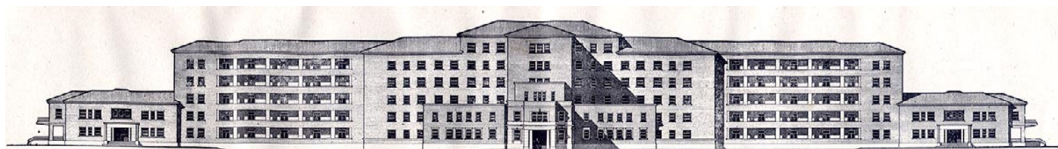
Sanatorio Antituberculoso Alzado tipo