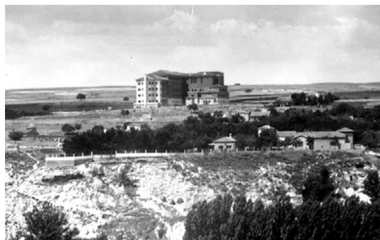
Sanatorio Antituberculoso de Teruel proyecto de 1951