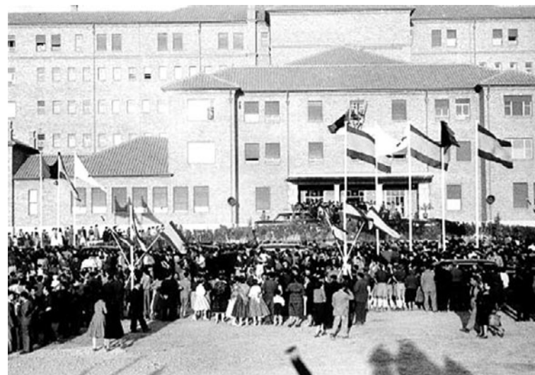
Inauguración de la Residencia Sanitaria de Teruel 15 de junio de 1953