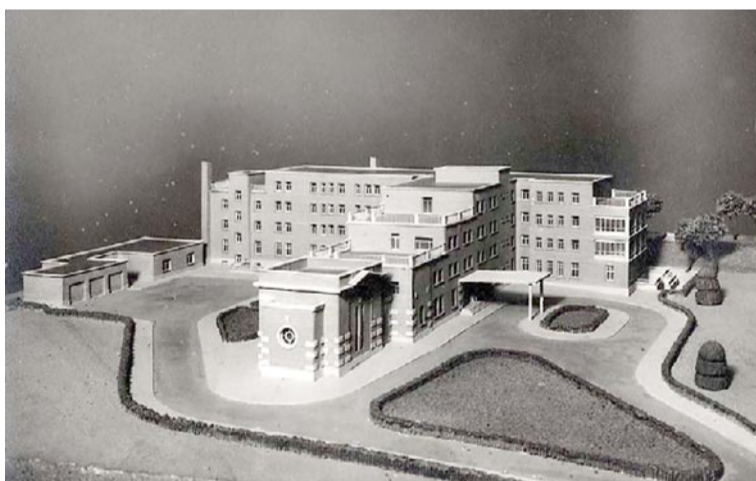
Residencia vieja de Guadalajara construida en 1954 que se intentó derribar en 2010