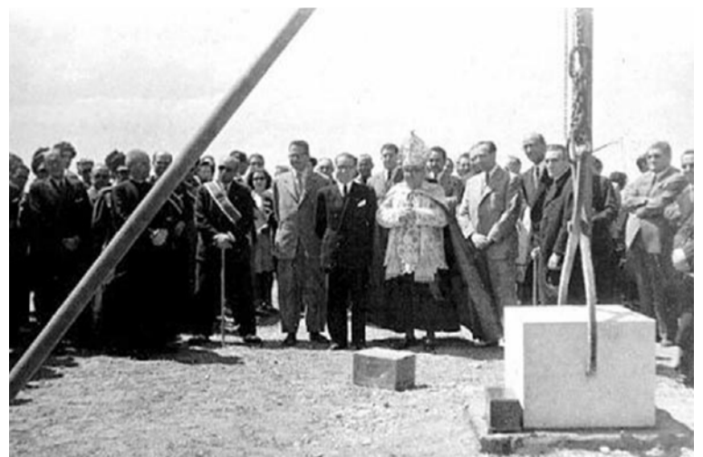
Colocación de la primera piedra de la Residencia Sanitaria de Teruel

tadio de deportes, se cedieron del patrimonio municipal según consta en un expediente de 1948 del Archivo Provincial.