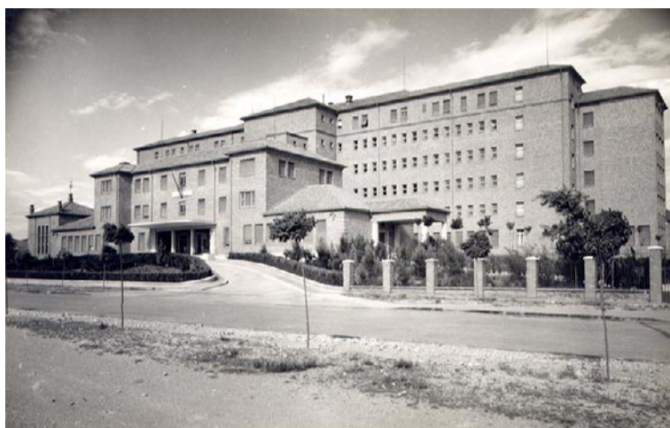
Residencia Sanitaria de Teruel, hoy Hospital Obispo Polanco 1948-1953