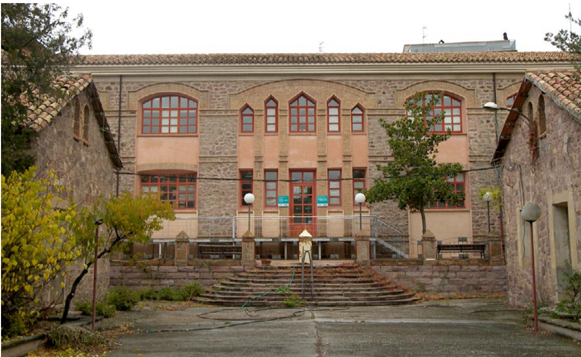
Pabellón de Infecciosos, 1915-1917