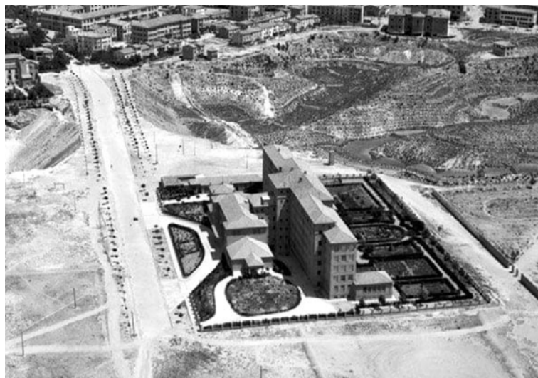
Vista aérea de la Residencia Sanitaria de Teruel 1948-1953