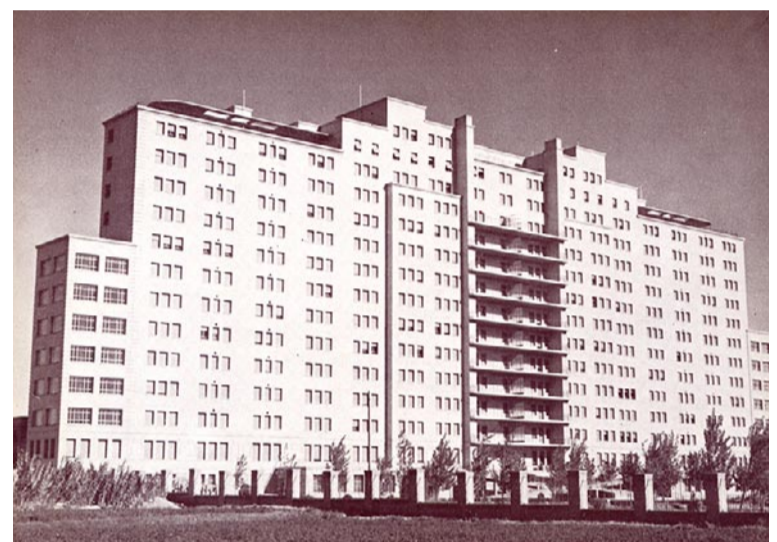
Arriba vista frontal y abajo vista trasera de la Residencia Sanitaria José Antonio, Hospital Miguel Servet. Zaragoza 1947-1952