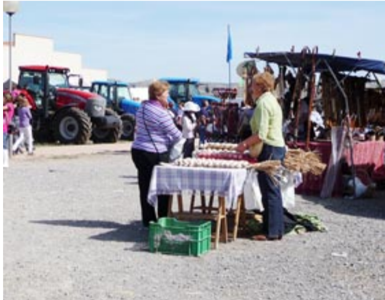
Esta edición contará con 80 expositores con productos de la zona. M. Izquierdo

“Siempre nos gusta contar con productores de la zona para potenciar los productos de aquí, darlos a conocer y que exploren hacia afuera. Esta feria es la ocasión perfecta para ayudar a que se conozcan, para buscar esa promoción, esa calidad y en definitiva que haya un sustento de los productos que salen del campo y que sirva para mantener, no solo a las personas que se dedican a esto, sino para seguir man-