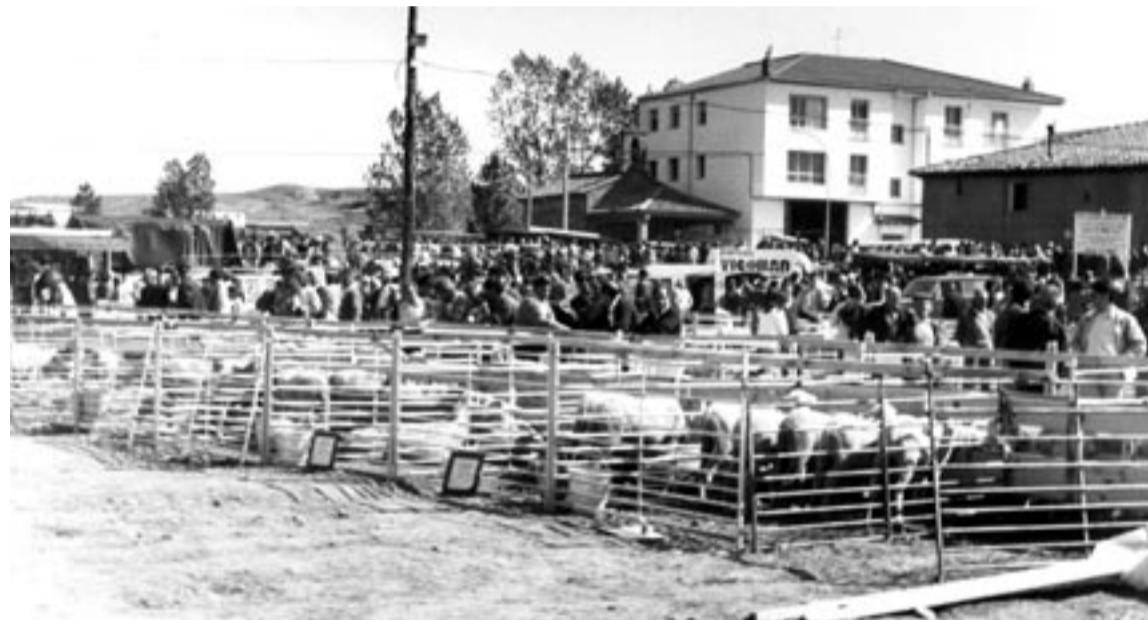
Expositor de ganado ovino en la Feria de Cedrillas.

Los dos últimos años el certamen tuvo que adaptarse a las circunstancias de la pandemia y fue telemática