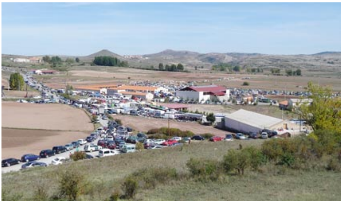
Las jornadas arrancarán mañana a las 17:00 horas en el salón de actos del recinto ferial