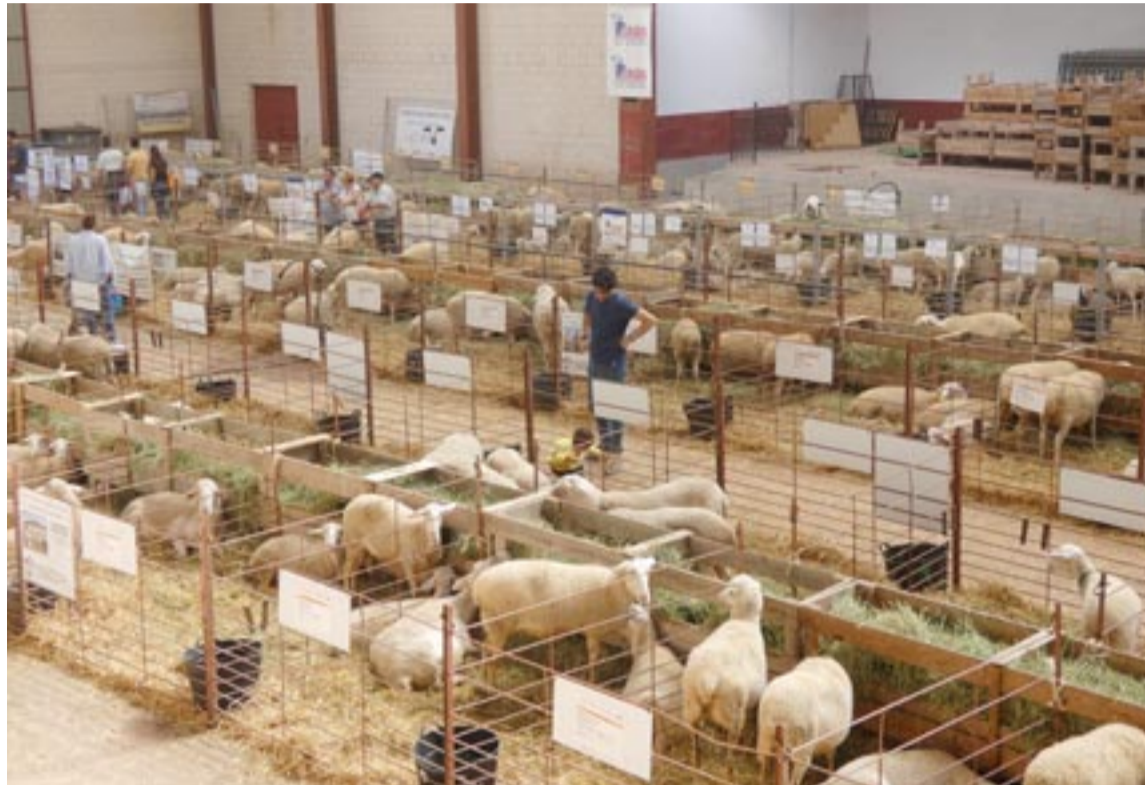
Las subastas del sábado y el domingo contarán con lotes de razas autóctonas como la Rasa Aragonesa. M. Izquierdo

Muchos de estos animales son de razas autóctonas de Teruel y de Aragón, como el lote de ganado ovino de Rasa Aragonesa que se subastará en la mañana del sábado o razas de bovino como la Serrana Turolense o la Bruna de los Pirineos -propia de la región