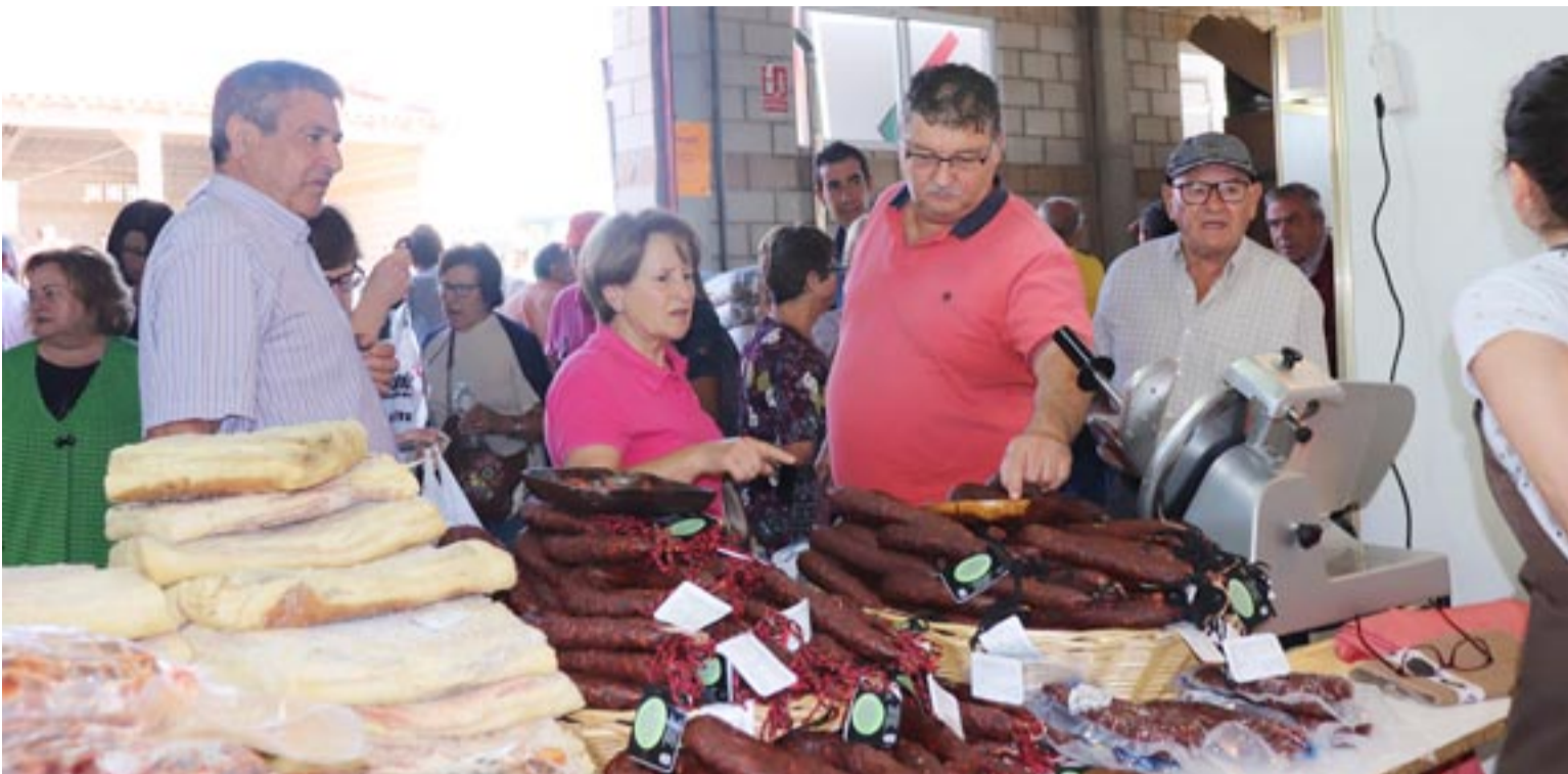
Productores de toda la provincia se dan cita en esta feria para comercializar sus artículos.