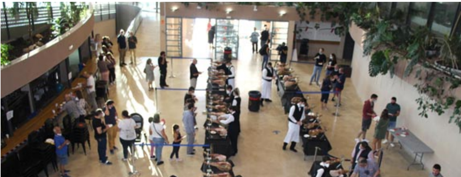
Participantes en el Túnel del Sabor que se celebró el año pasado por primera vez en la cafetería del Palacio de Exposiciones