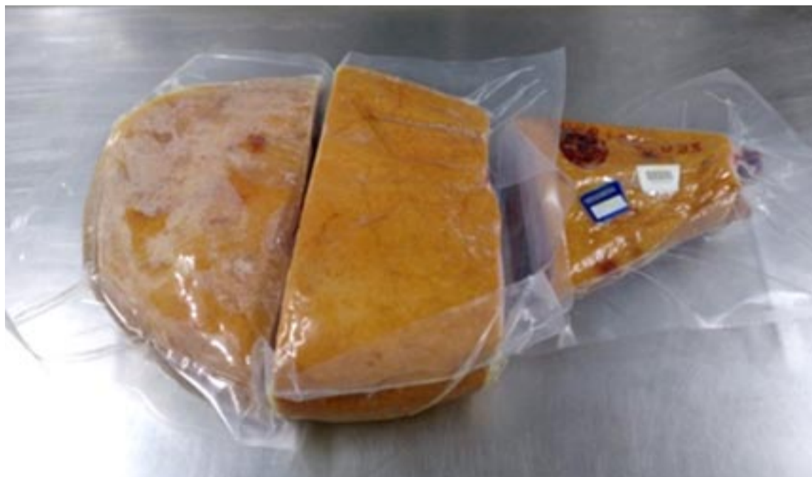
Uno de los jamones troceado en tres partes (jarrete, maza-contramaza y punta) para su posterior análisis

de cuatro tipos de animales (machos castrados, machos inmunocastrados, hembras enteras y hembras inmunocastradas) que habían sido curados durante casi 20 meses.