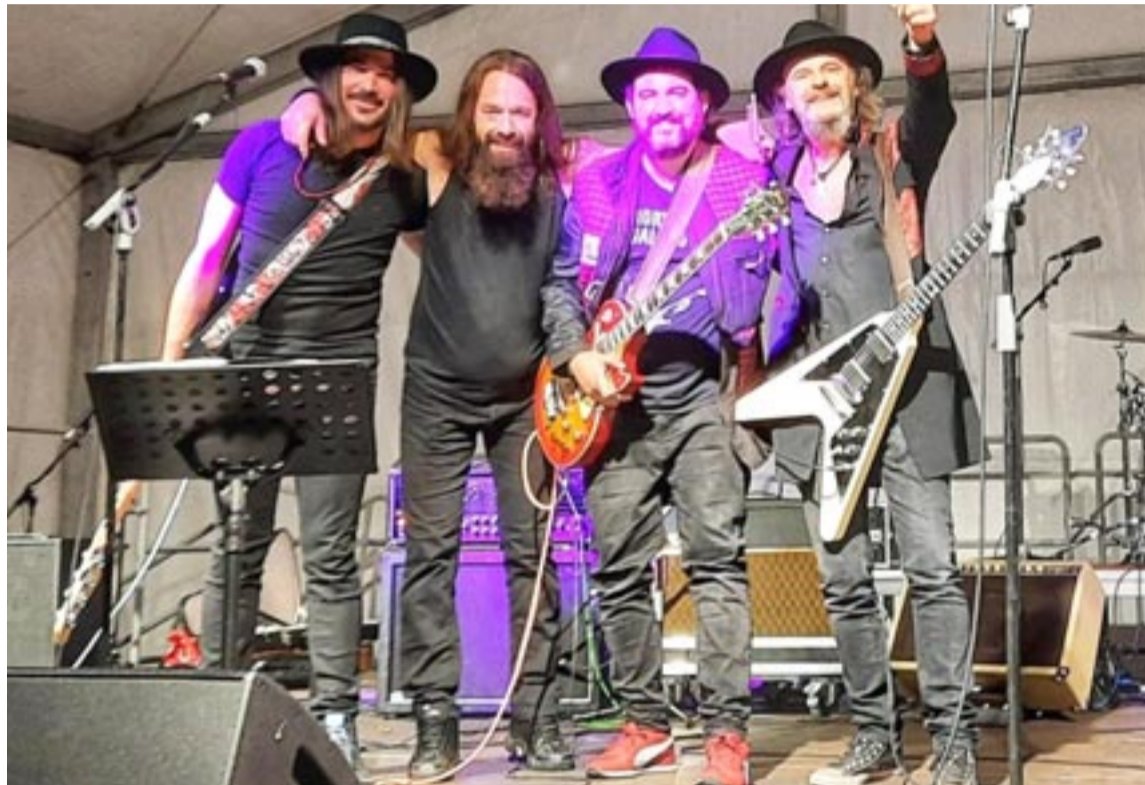
La banda Abismo durante la quinta edición del Jam On Fest, el pasado año

La sexta edición del Jam On Fest se reduce de las dos noches del pasado año a una sola, la del sábado, con ocho bandas que comenzarán a tocar a partir de las 21 horas en el escenario instalado en La Glorieta. Lo más destacado de la velada será que Abismo ofrecerá la primera presentación de su nuevo disco, Esperando al Ángel Negro , que sale