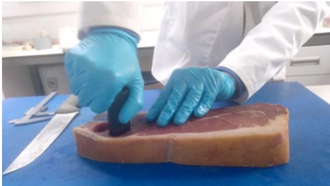
Un técnico toma muestras de un Jamón de Teruel con Denominación de Origen Protegida para su posterior análisis