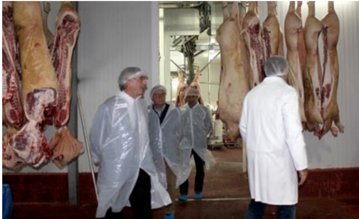
Canales de cerdo destinado a la Denominación de Origen Protegida Jamón de Teruel.

El nuevo marchamo de calidad supone un espaldarazo a toda la canal y a la rentabilidad de la carne fresca