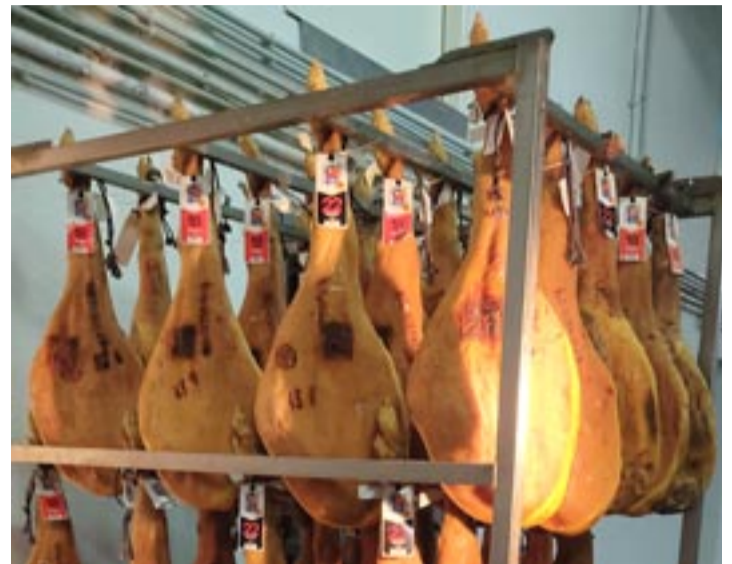
Piezas de Jamón de Teruel DOP etiquetadas con las nuevas vitolas

Los jamones y paletas de la DOP siempre están identificados con la palabra Teruel y la estrella de ocho puntas marcadas a fuego. Y ahora, con carácter voluntario, se permite en el etiquetado de piezas enteras, deshuesadas, porciones o loncheados amparados por la denominación la utilización de las siguientes menciones facultativas: en el caso de los jamones, "Más de 22 meses" cuando el periodo mínimo de elaboración sea de 96 semanas y el peso en el momento de la calificación sea igual o superior a 9 kilogramos, o "Más de 18 meses" (76 semanas y 8 kilos); y en el de las paletas, "Más de 11 meses" (48 semanas y 5,5 ki-