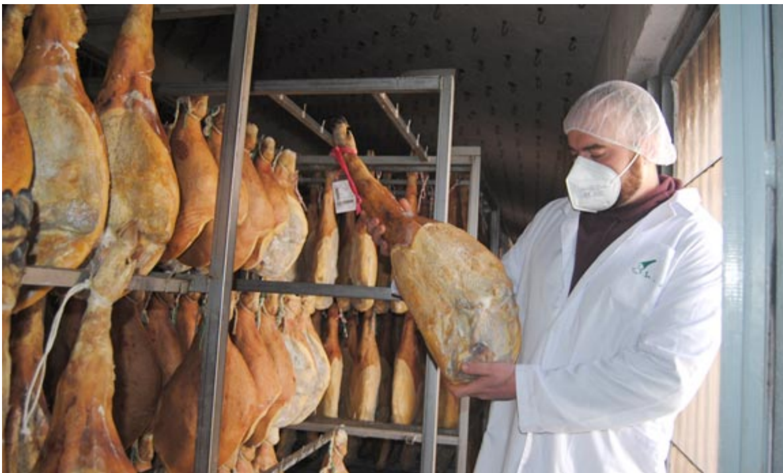
Un maestro jamonero, en un secadero de la provincia de Teruel controlando el estado de un jamón ya listo para la venta