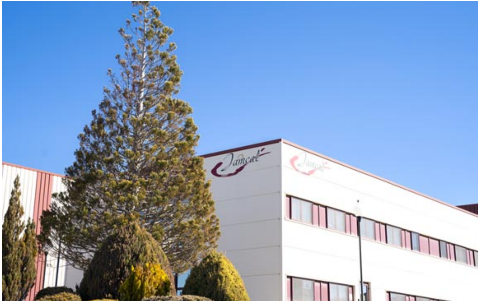
El edificio de Jamcal

Las dos empresas del Grupo Vall Companys, que generan casi 400 empleos, elaboran y comercializan el pernil con DO Teruel El Ontanar