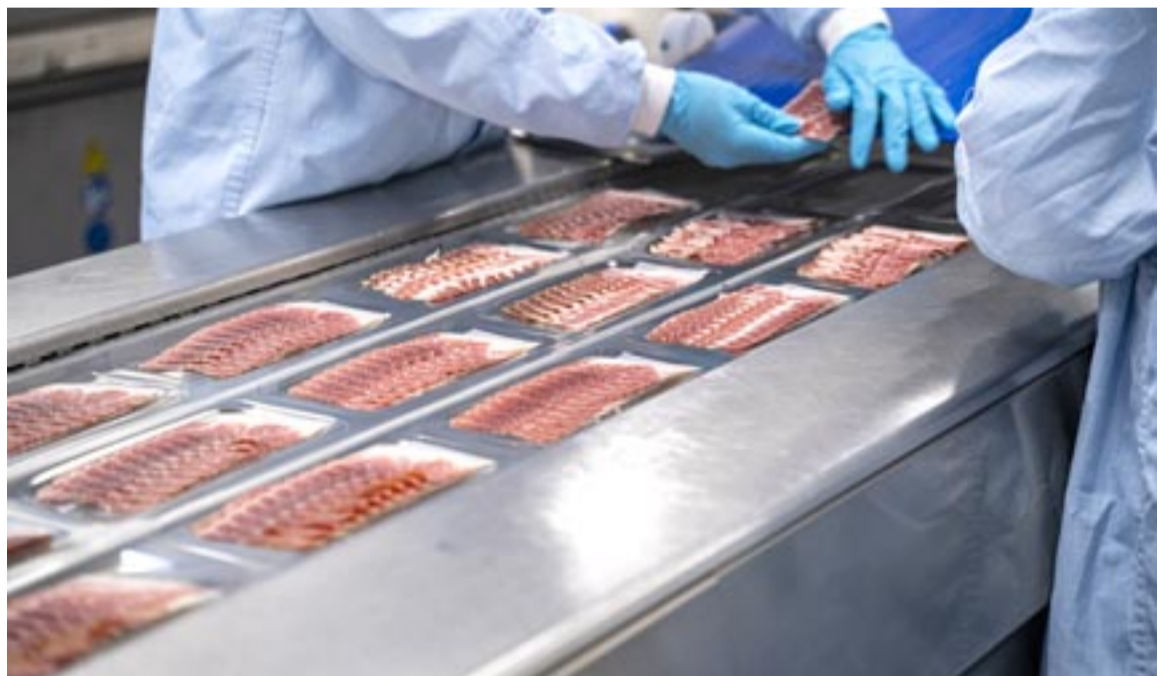
Loncheado de jamón

Más allá de las grandes cifras de empleo cabe destacar que el Grupo Vall Companys destaca por ser la primera compañía del sector cárnico con certificación laboral Top Employer 2021 y 2022. Con este sello; la auditora Top Employers Institute certifica y reconoce el buen trabajo en po-