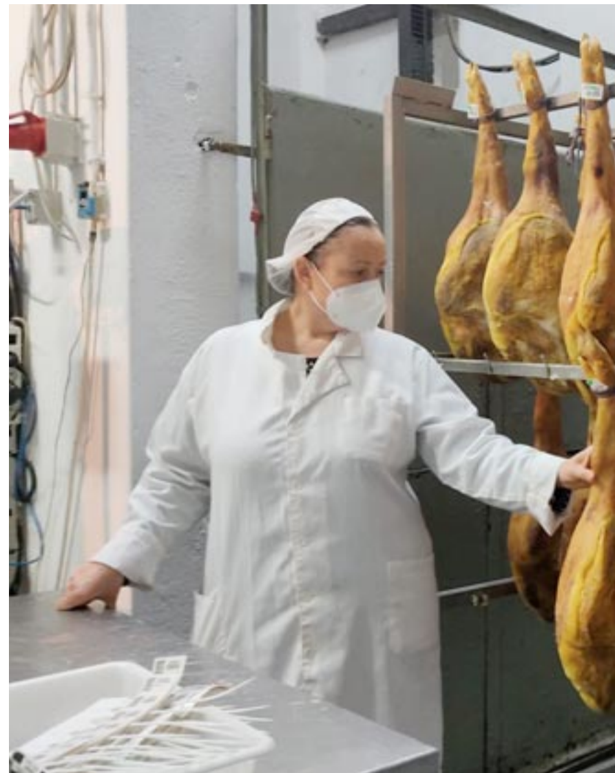
La operaria de un secadero realiza el marcaje y etiquetado de los jamones

Uno de los principales soportes de la campaña fue un anuncio publicitario que, en clave de humor y por medio de un personaje singular llamado Emilio, explicaba que el frío seco de Teruel hace que su jamón necesite menos sal para su curación, convirtiéndolo en un jamón diferente al resto, que le ha hecho ser merecedor de