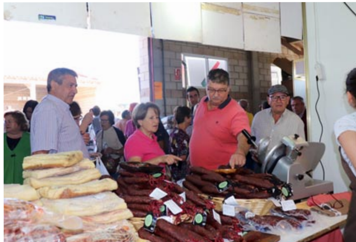
La última edición de la feria que se pudo celebrar en las calles de Cedrillas fue en 2019

Desde la organización han apostado por la plataforma Zoom para realizar las jornadas telemáticas