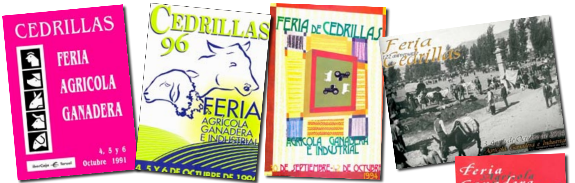
Los rótulos que se someten a la votación se remontan a 1991 y cuentan con diferentes tipos de estampados e ilustraciones