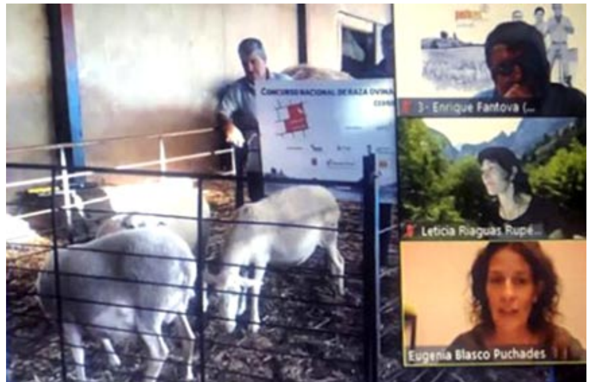
Captura de pantalla de las Jornadas Ganaderas que se celebraron ayer de manera telemática