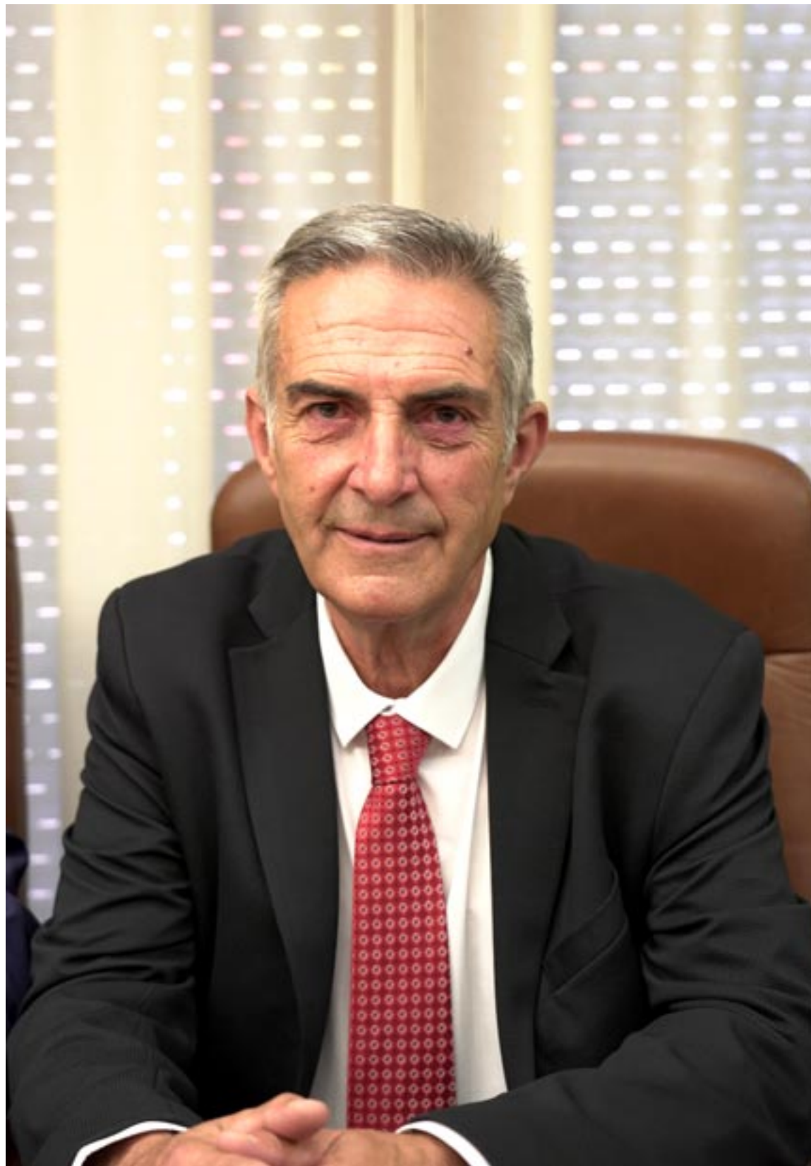
El regidor cedrillense confía en que el año que viene el evento pueda volver a salir a la calle

-El plato fuerte del programa siguen siendo las conferencias, el Concurso Nacional de raza Rasa y la entrega del Premio Martín Peinado a la mejor genética. Estos son los actos más importantes de la feria. Todo se hace de manera virtual, intentando man-