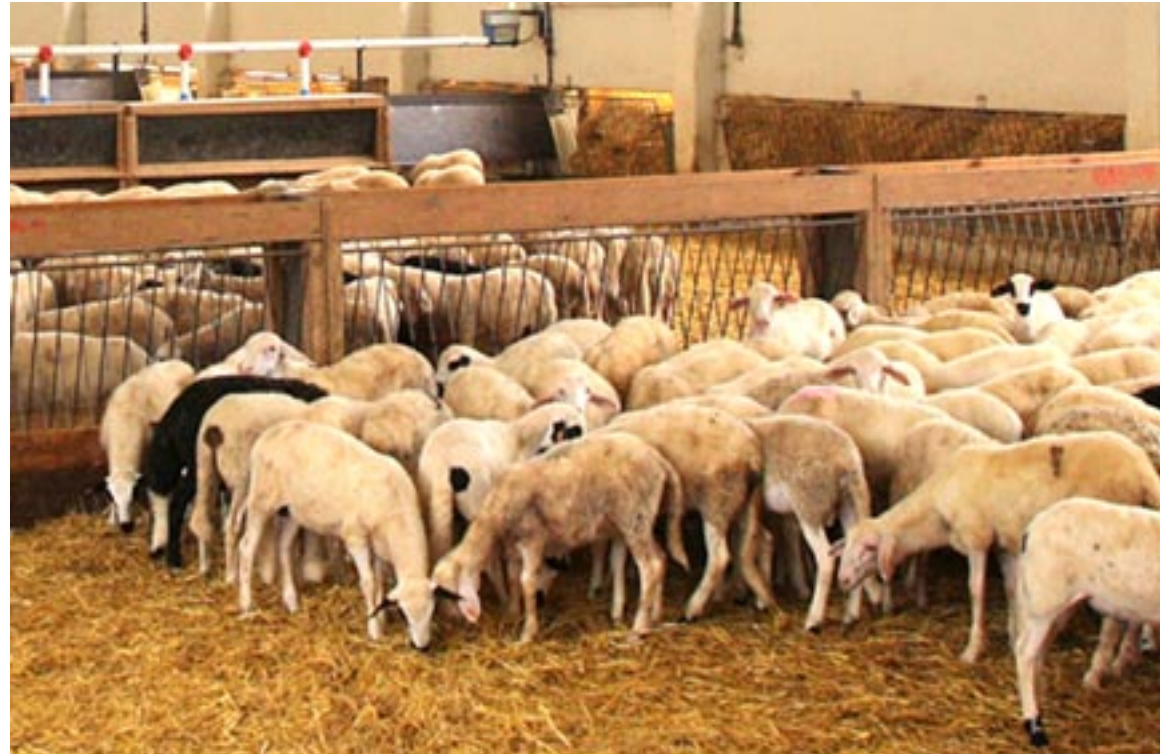
La Rasa Aragonesa es una raza ovina autóctona de Aragón cuyo origen proviene primitiva Ovis Aries Ligeriensis

Esta charla se enmarcaba en el Grupo de Cooperación OVICIRCULAR para la economía circular del sector ovino (GPC-2020-00-1000) llevado a cabo por Oviaragón y COTEGA, en colaboración con la Facultad de Economía de la Universidad de Zaragoza.