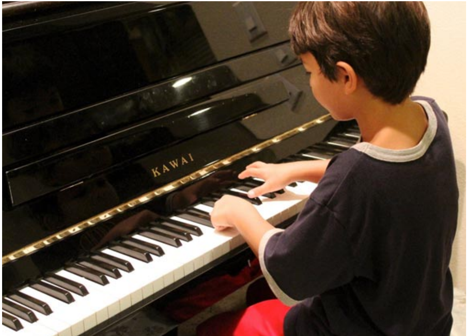
La práctica musical en los más pequeños puede ayudarles a forjar una rutina

Muchas veces las vacaciones ayudan a tomar conciencia de detalles que se podrían mejorar en la rutina. Esta vuelta también puede ser el momento ideal para buscar tiempo y maneras en las que mejorar aspectos como la gestión del tiempo, el manejo del estrés o la falta de sueño. Así, se podría minimizar el impacto de