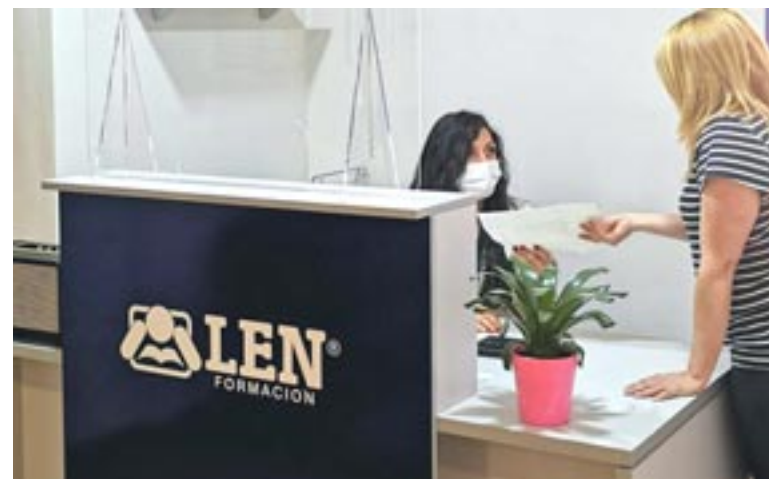
Instalaciones de LEN Formación en Teruel

El centro de formación se caracteriza por estar a la última, tanto en nuevas tecnologías como en innovación didáctica. Cada año es auditado y certificado por organismos de calidad nacionales y europeos, que les motivan a seguir en su constante renovación de sistemas, métodos y