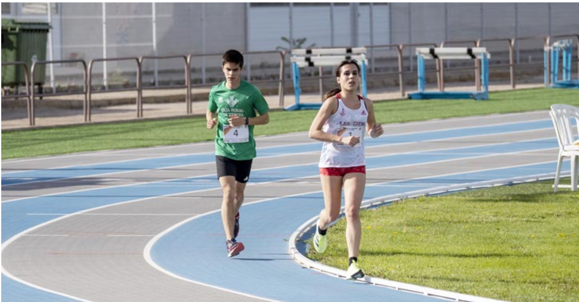
El consistorio trolense reabrió hace un año las pistas de atletismo José Navarro Bou tras los trabajos de arreglo y repavimentación.