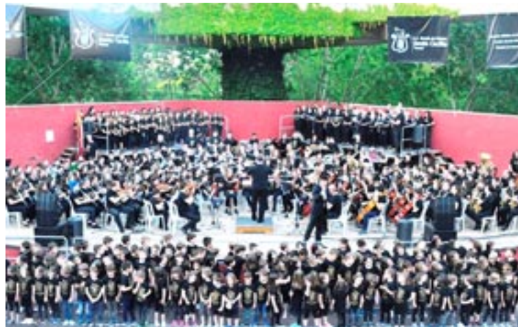
Concierto de la Escuela de Música en el auditorio del parque de los Fueros

La oferta se completa con la Formación de Conjunto en las distintas formaciones de la escuela, como la Banda Juvenil, la Orquesta Juvenil, el Ensemble de Guitarras, el Grupo de Música