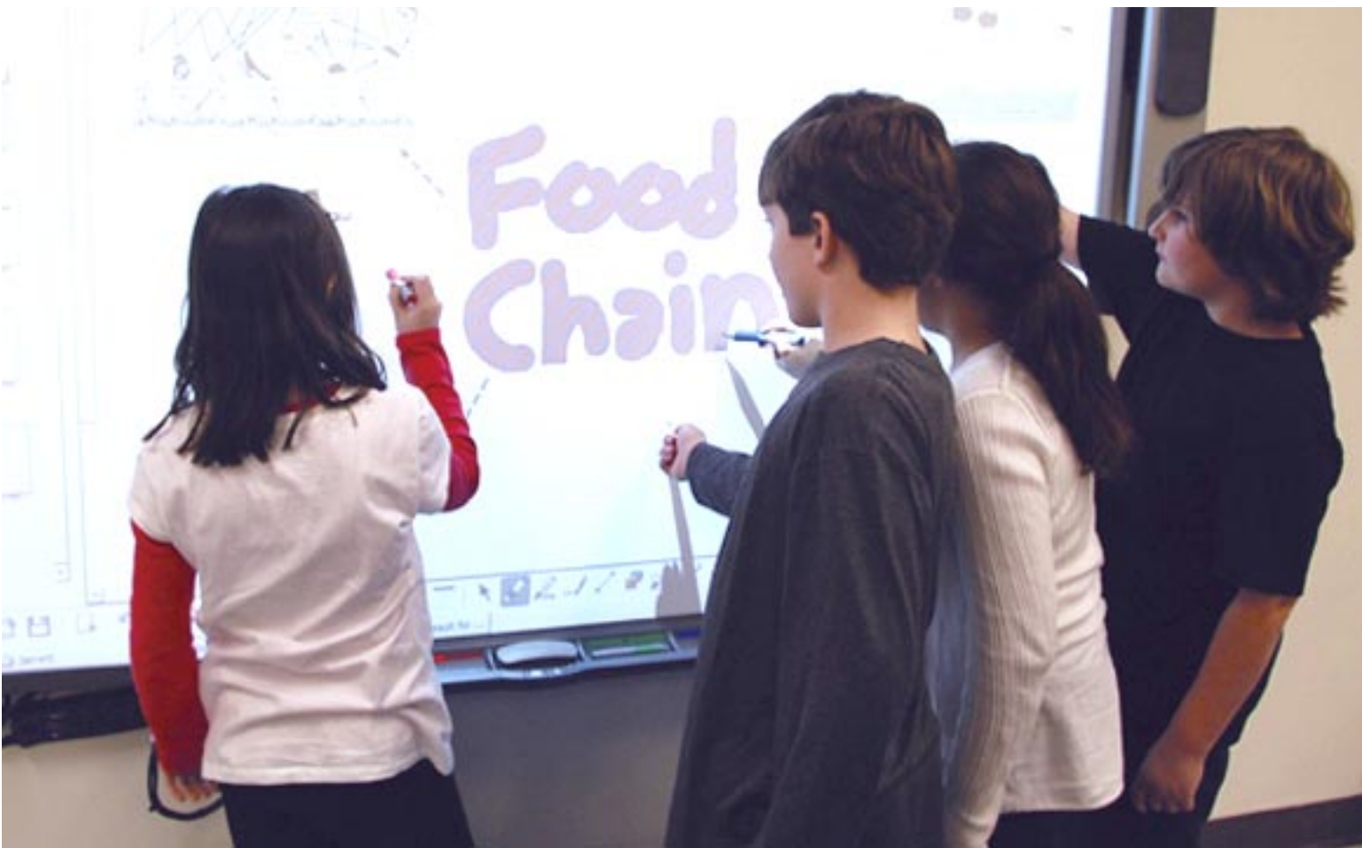
Las instalaciones de Kiwi First se encuentran en la calle Francia y disponen de las últimas tecnologías para favorecer la enseñanza