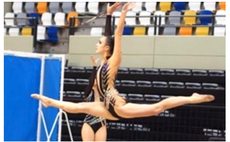
El centro dispone de un grupo de iniciación y otro de competición

Son muchas las chicas que, a partir de los seis o siete años deciden dar el paso a la competición, aunque para acceder es ne-