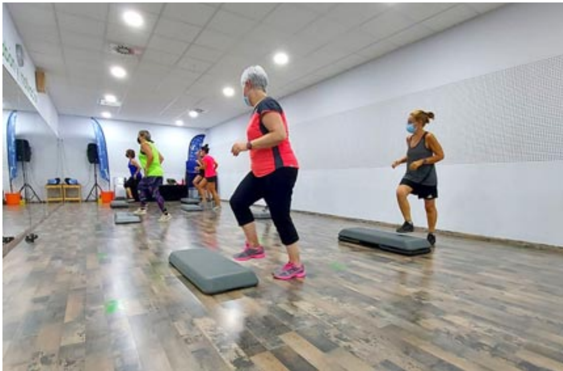
El step es una de las diferentes actividades que oferta el centro para favorecer la movilidad

En el mismo sentido, el trabajo funcional cuenta con un estudio previo y un trabajo adaptado para conseguir una mejora. Se trata de un entrenamiento más dinámico, en el que se trabaja con más intensidad y se buscan patrones de movimiento para co-