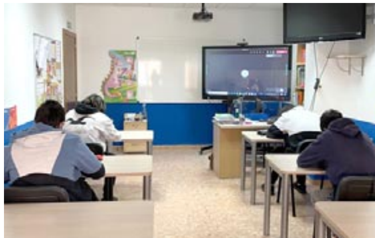
El centro utiliza una pantalla digital para realizar clases online y duales

La fama precede a este profesor gracias a sus buenos métodos y su amplia experiencia docente.