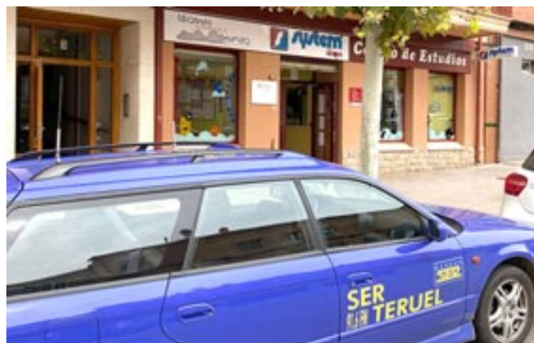
Sixteam mantiene las instalaciones en la avenida Segorbe, 5

También en el inglés refuerzan su oferta con cursos de todos los niveles hasta el C2 y preparación de exámenes oficiales de Cambridge y Linguaskill. De hecho, Sixteam es el único centro