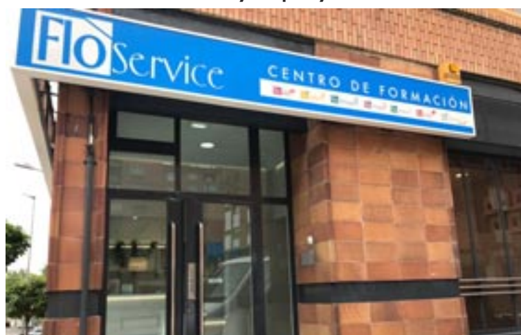
Las instalaciones de Flo Service en Teruel se encuentran en la avenida Aragón

Por otro lado, dispone de cursos para preparación de oposiciones a Celador, PSD (Personal de Servicio Doméstico) y Auxi-