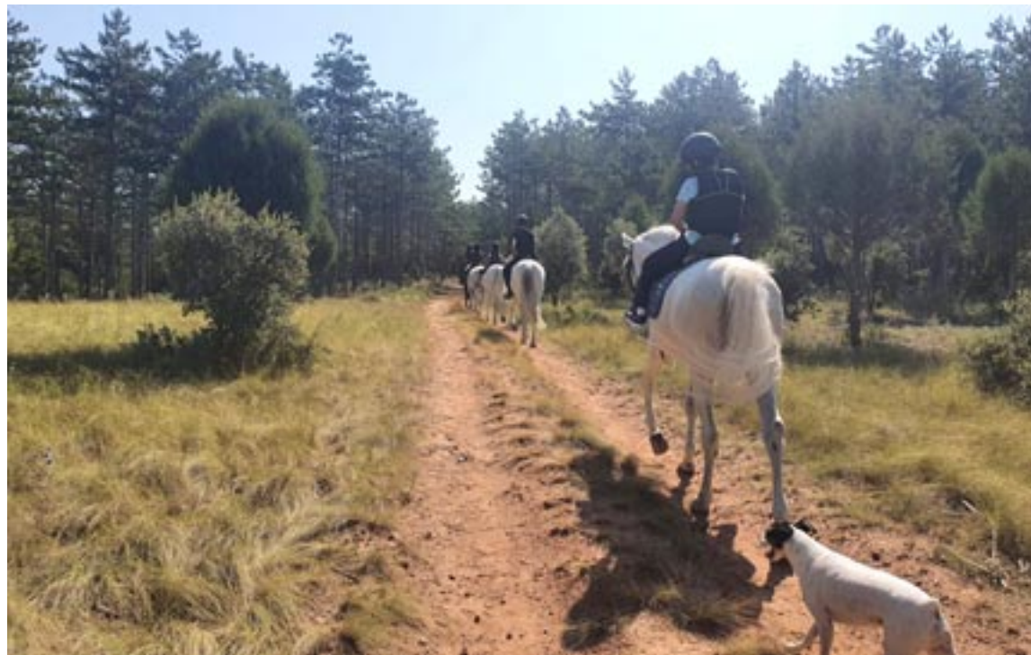
El centro ofrece paseos a caballo por los caminos que rodean el paraje de la Hípica Valdelobos

Además de clases para aprender a montar a caballo, en el centro también tienen la opción de pupilaje, que consiste en que personas particulares pueden dejar allí sus caballos a buen cuidado, porque el personal de la Hípica Valdelobos se encarga del cuidado, limpieza y alimentación del animal, estando en el mejor estado para cuando su dueño acuda a montarlo.