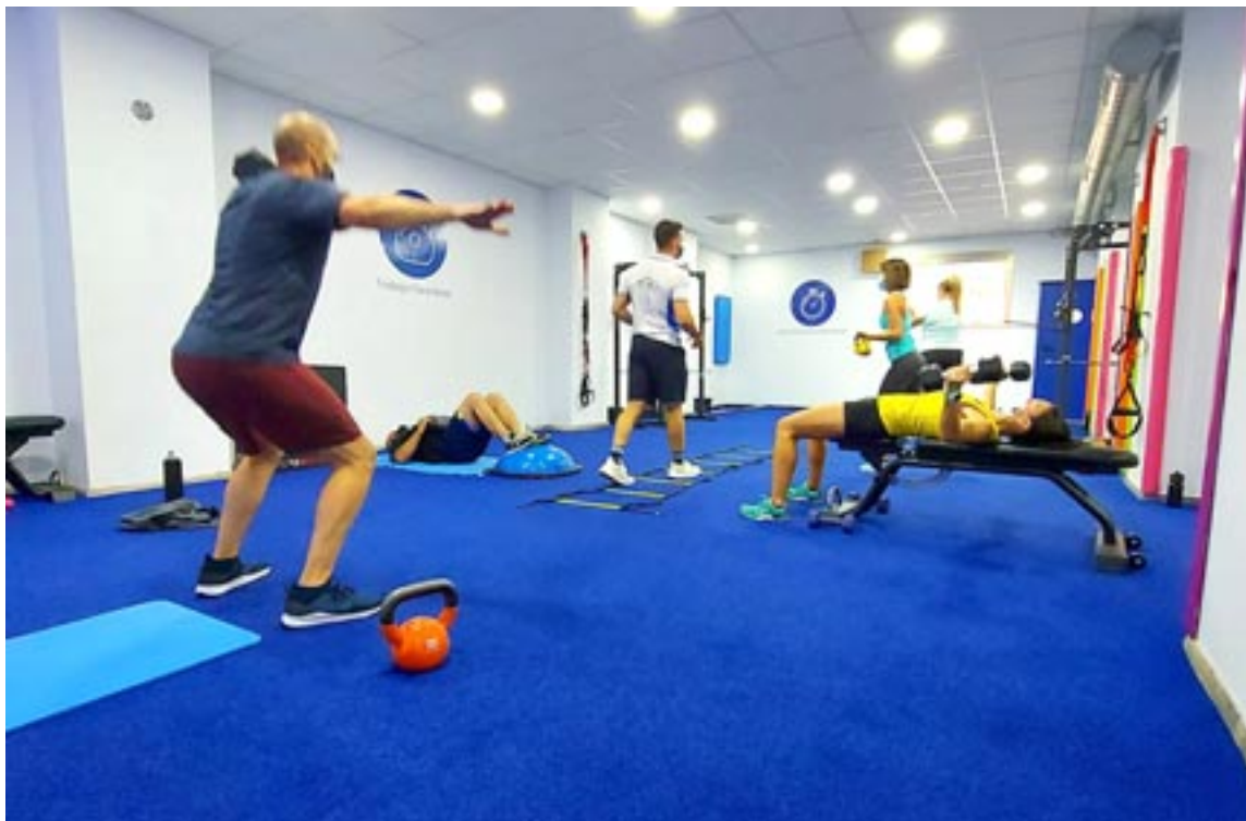
No te excuses cuenta con alternativas para todas las edades en las distintas salas que dispone