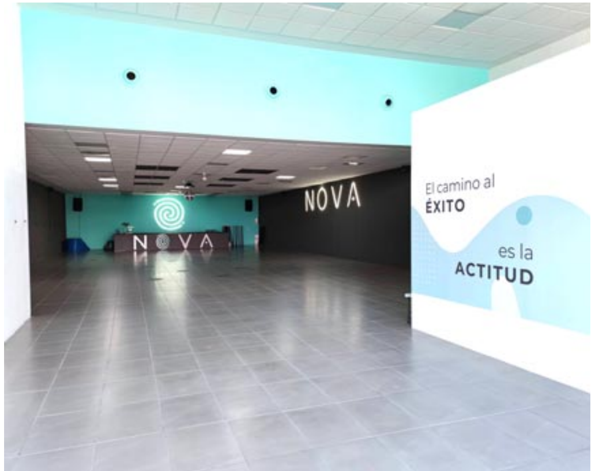
Nova Fitness cuenta con más de 300 metros cuadrados en la calle Colonia del Polígono La Paz

En Nova, se imparten clases tanto en horario de mañanas como de tardes. El pasado lunes 6 de septiembre dieron comienzo sus clases tanto de pilates como de fitness. Para más información pueden visitar su página web, www.novateruel.es o sus redes sociales.