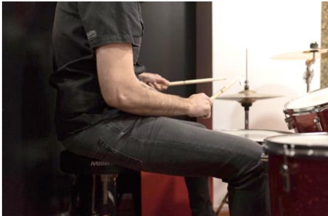
El centro de estudios musicales está especializado en el lenguaje moderno desde 2013, cuando abrió sus puertas. Coolte.net

On Music abrió sus puertas 2013 con el principal objetivo de ofrecer a la ciudad otra forma diferente de acercarse a la música.