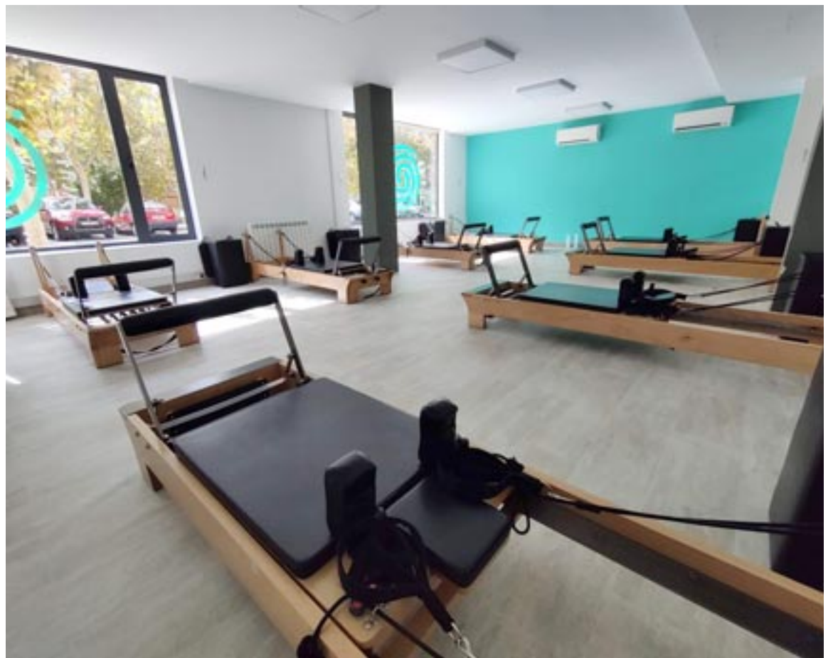
Instalaciones de Pilates Máquinas en el centro de Nova en la Fuenfresca