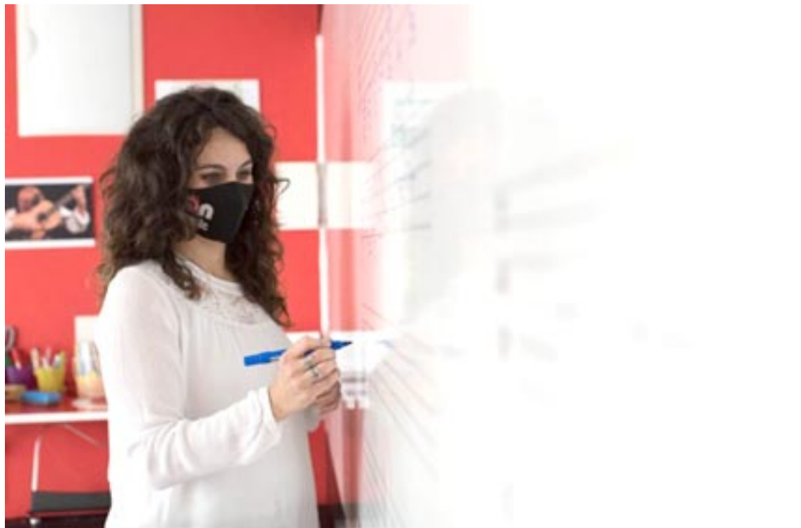
On Music ofrece un programa de estudios adaptado a todos los niveles y un equipo de cinco profesionales. Coolte.net