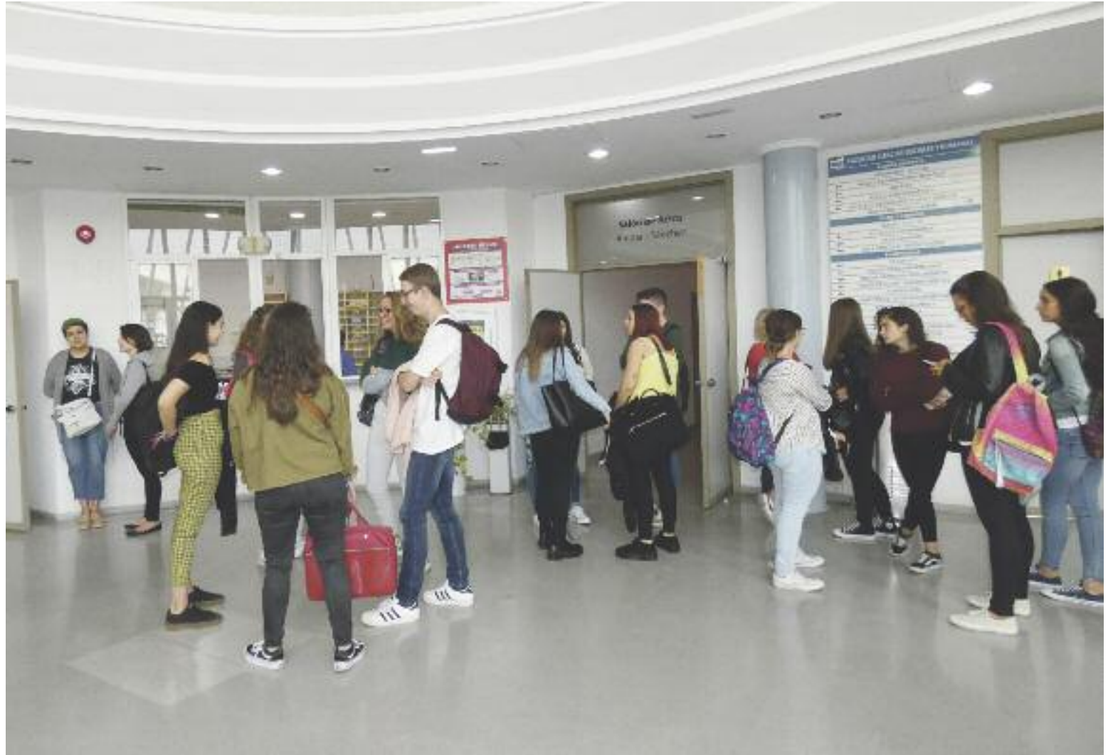
Alumnos en la Facultad de Ciencias Sociales y Humanas del Campus de Teruel de la Universidad de Zaragoza

La vicerrectora del Campus asegura que “el objetivo de intentar que toda la diversidad social estuviese en las diferentes titulaciones está en la política universitaria desde hace mucho tiempo” pero reconoce que las cuestiones culturales llevan a que algunas carreras atraigan más a las