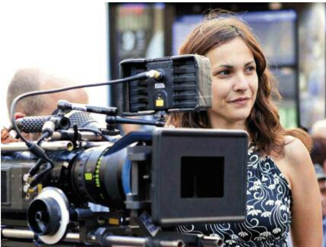
La cineasta Paula Ortíz, con raíces familiares en Villahermosa del Campo, ha estado nominada a tres premios Goya

Alonso en que en el arte se segrega a la mujer como en todos los ámbitos de la vida, ni más ni menos. Bueno, sí: “Estas dificultades para acceder al mercado laboral se agravan en actividades que implican toma de decisiones arriesgadas, y así ocurre en el arte, en el que nada te garantiza que lo que estás haciendo vaya a tener éxito”. Para Ortíz, “en el cine en particular las necesidades de presupuesto y quipos son enormes, y eso hace que la industria, que es cobarde, ponga muchos reparos a la hora de encomendar grandes proyectos a una mujer joven. Y cuando esta tiene la suficiente experiencia para generar confianza, entonces se topa con el resto de decisiones vitales, como la maternidad o el cuidado de los otros, que sigue recayendo en las mujeres”. El resultado es que “de cada 100 películas en España solo 7 están dirigidas por mujeres”, explica Ortíz, “y te aseguro que con presupuestos cinco veces más pequeños que la media de proyectos que dirigen los compañeros hombres”. En su faceta como profesora universitaria, “nunca he sentido personalmente estar luchando en desigualdad de condiciones, pero en el cine sí que me he en-