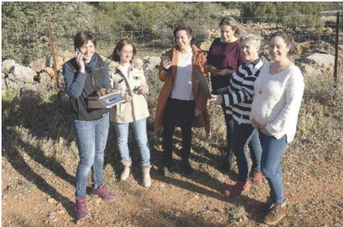
Mujeres que se ocupan de la parte técnica y creativa de la trufa.