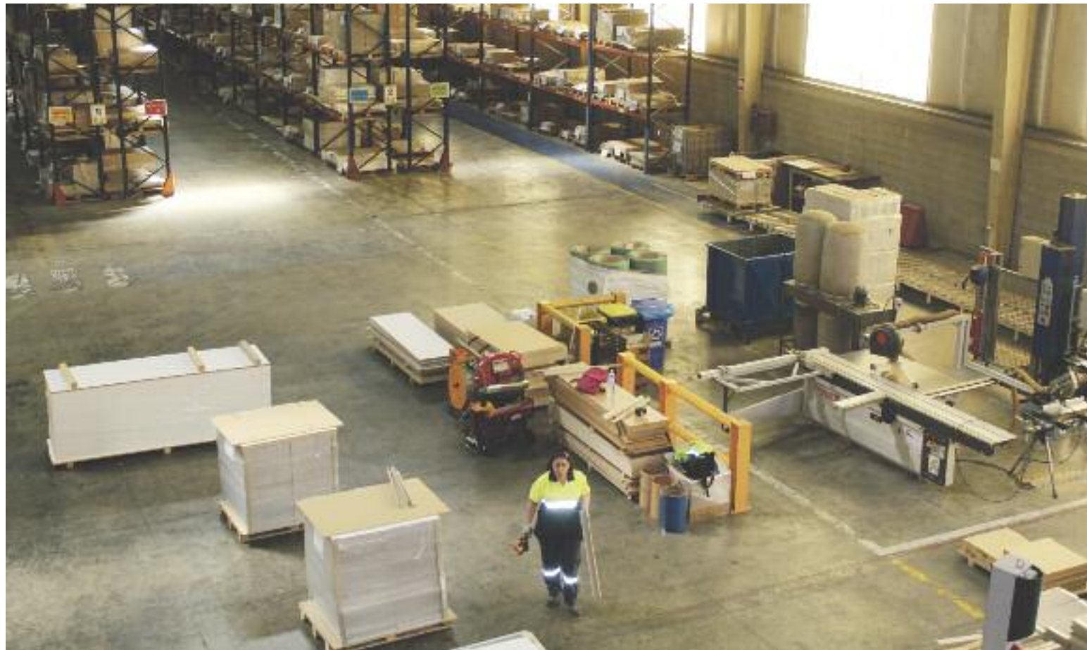
Vista general de la planta Cella I de Financiera Maderera SA (Finsa), en la que más de la mitad de los empleados son mujeres.

Aunque estos datos hacen referencia al ámbito nacional, son extrapolables a la provincia de