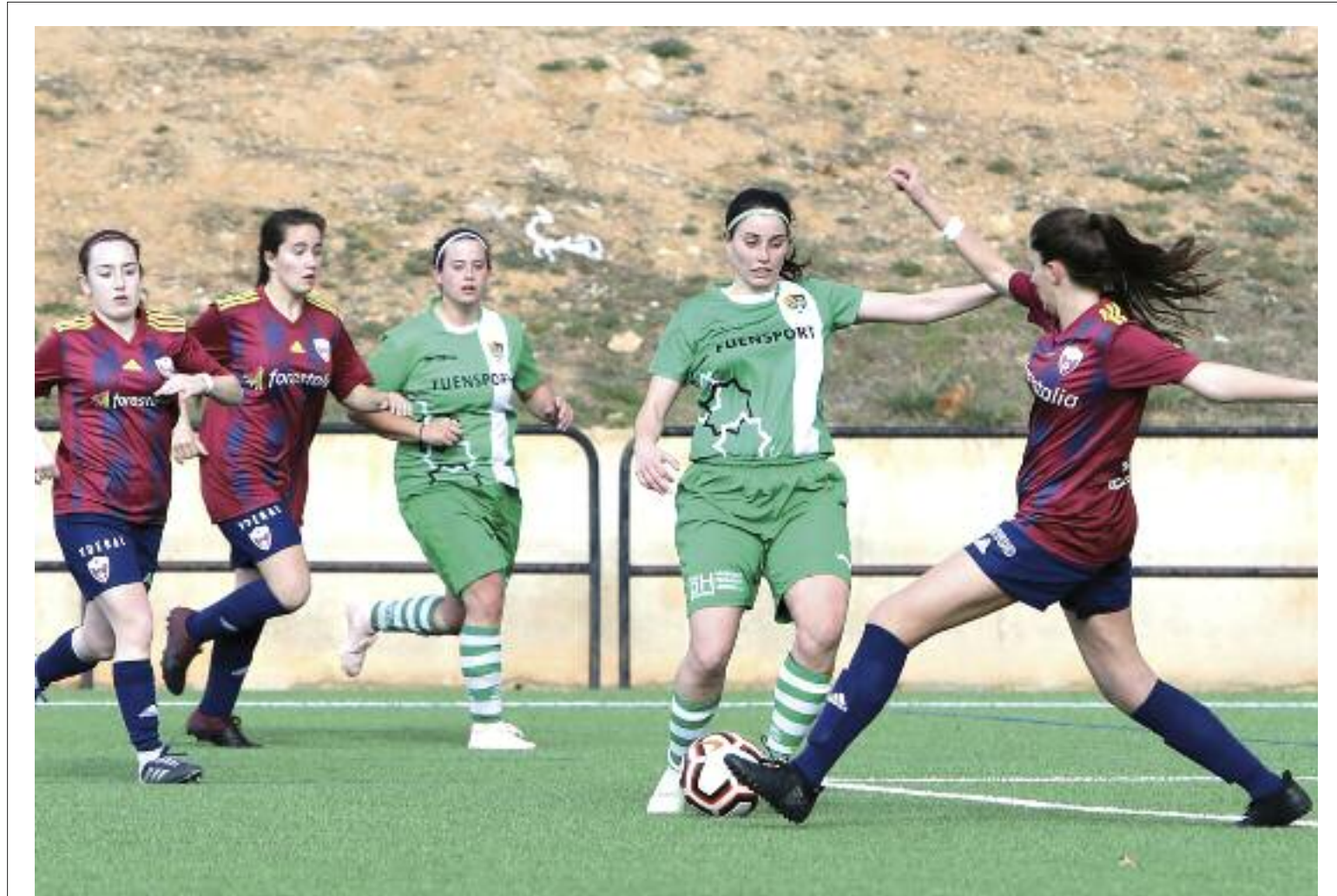
Partido de fútbol entre el Fuensport femenino y el Villanueva en las instalaciones del Luis Milla, en Teruel. Escribiche

La decisión de tener un hijo no es baladía, y menos aún para