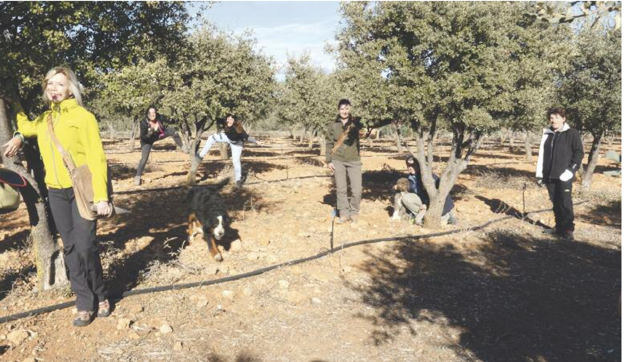
Las recolectoras de trufa son habituales en los campos de Teruel, en la imagen, algunas de ellas.