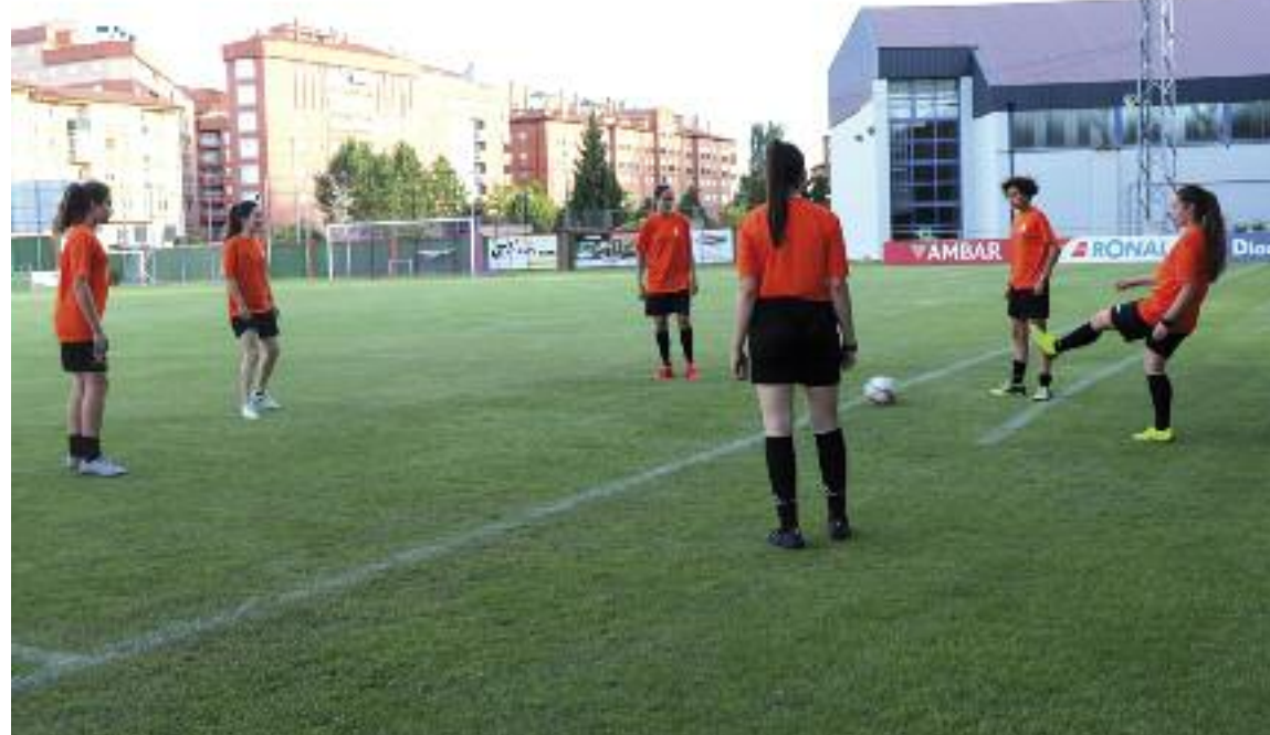
Jugadoras del CD Teruel femenino, durante un entrenamiento en Pinilla.