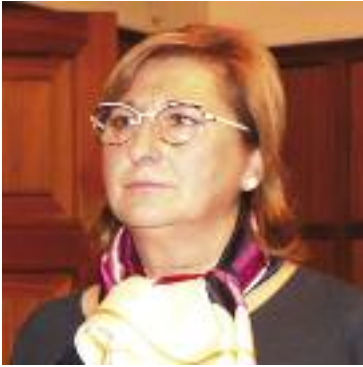
Carmen Pobo Senadora del Partido Popular

La lucha diaria de todas las mujeres ha dado sus frutos, aunque siempre queda mucho por andar