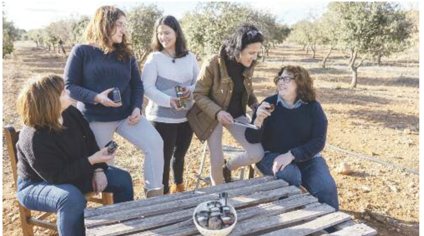
Las mujeres terolenses han hecho historia en el sector de la conservación de la trufa.