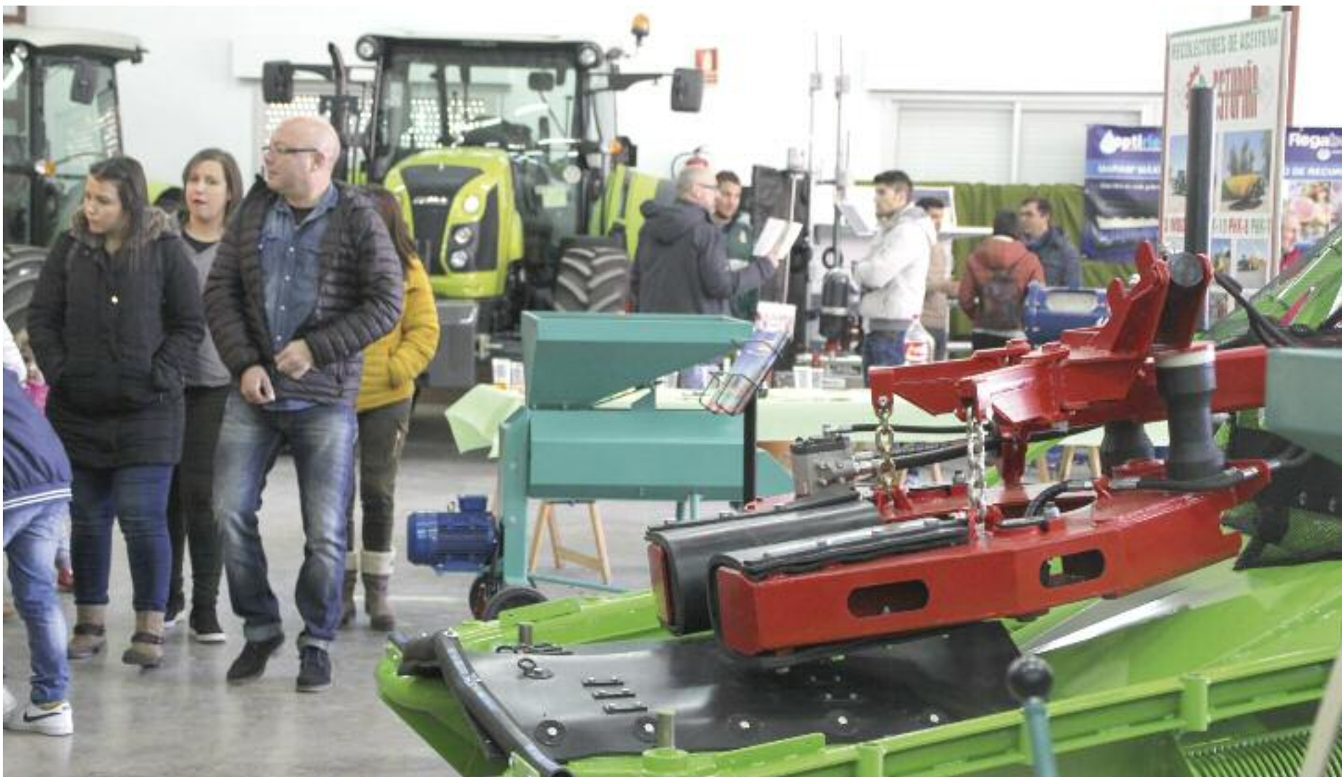
Maquinaria agrícola para la recogida de la almendra en una edición anterior del certamen