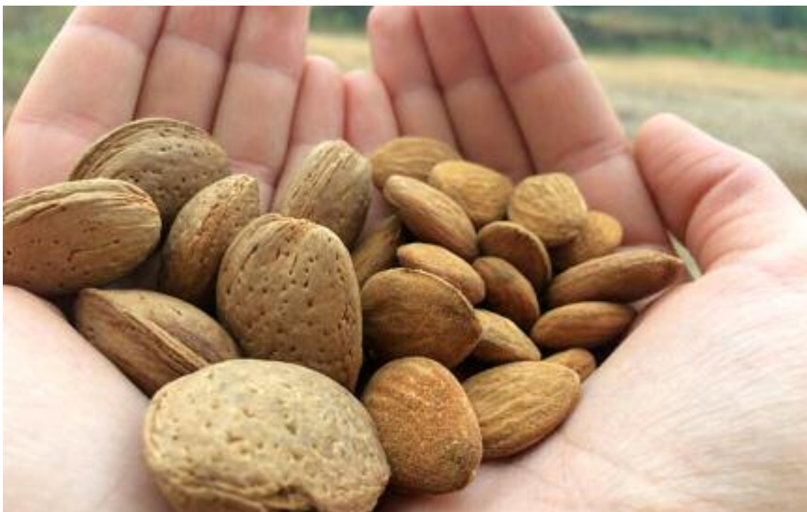
Las almendras amargas son un problema español que se intenta erradicar