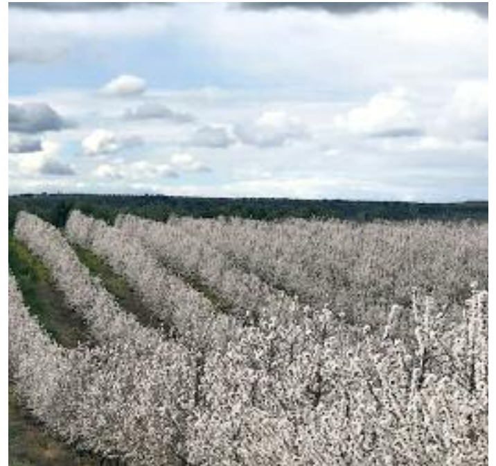
Plantación de almendros en sistema superintensivo