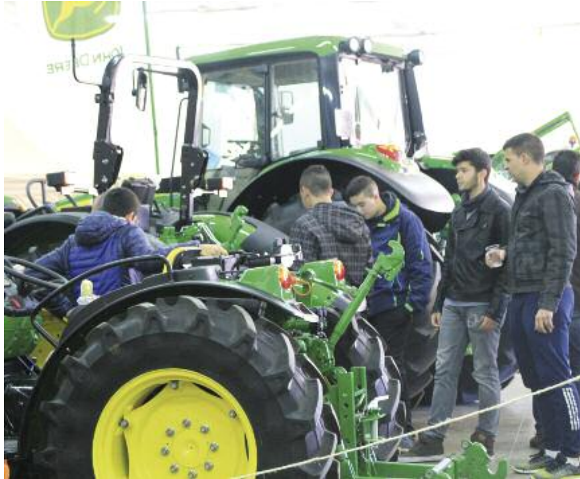
Los tractores, uno de los grandes atractivos del evento ferial

Pese a ser un país productor de almendra, el alto consumo de frutos secos en España hace que la balanza comercial española sea negativa en este ámbito, ya que, según datos de INC, en España se importan alrededor de 170.000 toneladas de frutos secos anuales, frente a las 93.000 que se exportan de media fuera. Y entre los frutos secos que más se importan a España figura la almendra, seguida de las nueces, los pistachos y los anacardos, mientras que los frutos secos que más exporta al exterior