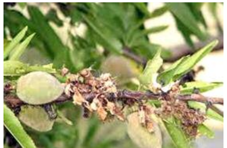
Monilia o podredumbre parda

Para realizar un seguimiento y estimación del riesgo para el cultivo, hay que hacer una observación durante el ciclo vegetativo del estado de las flores, las flores y los frutos.