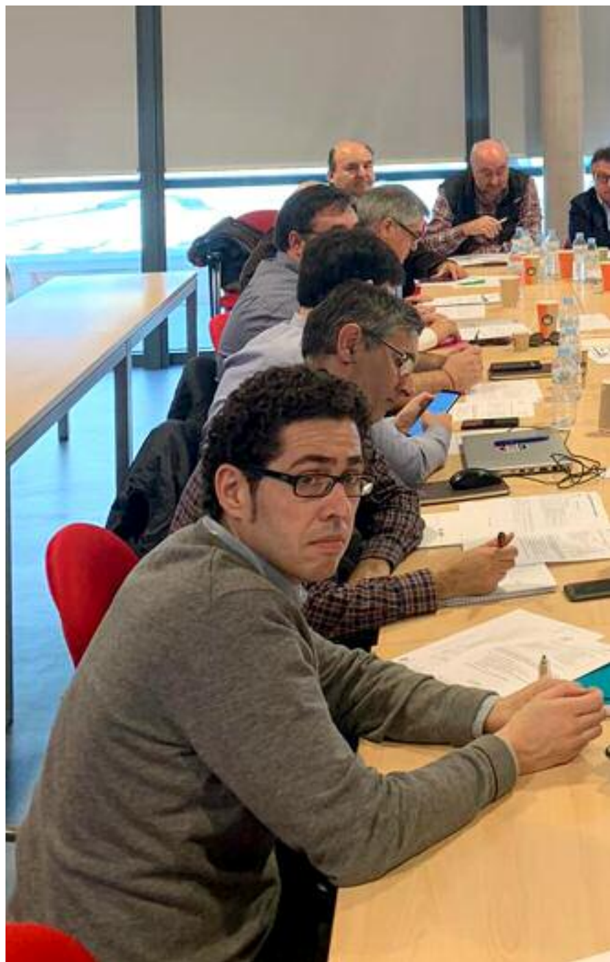
Reunión del grupo de trabajo que investiga sobre la almendra amarga

Si se quiere conseguir este objetivo y dotar al sector almendrero de un producto de gran calidad y referente para competir en los mercados, hay que hacer que la almendra que se recolecta en el campo y se procesa en la industria esté libre de partidas de almendra amarga. Hay que tener en cuenta que una mínima cantidad de almendra amarga en un lote de almendras dulces, deprecia toda la cadena de valor del producto.