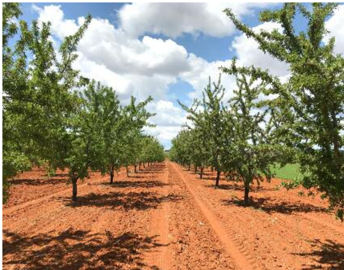
Parcela de almendros

Estas organizaciones han contado con la asistencia técnica del IRTA, Instituto de Investigación y Tecnología Agroalimentarias de la Generalitat de Cataluña. Toda la información se ha puesto a disposición de las lonjas nacionales y de los mercados internacionales