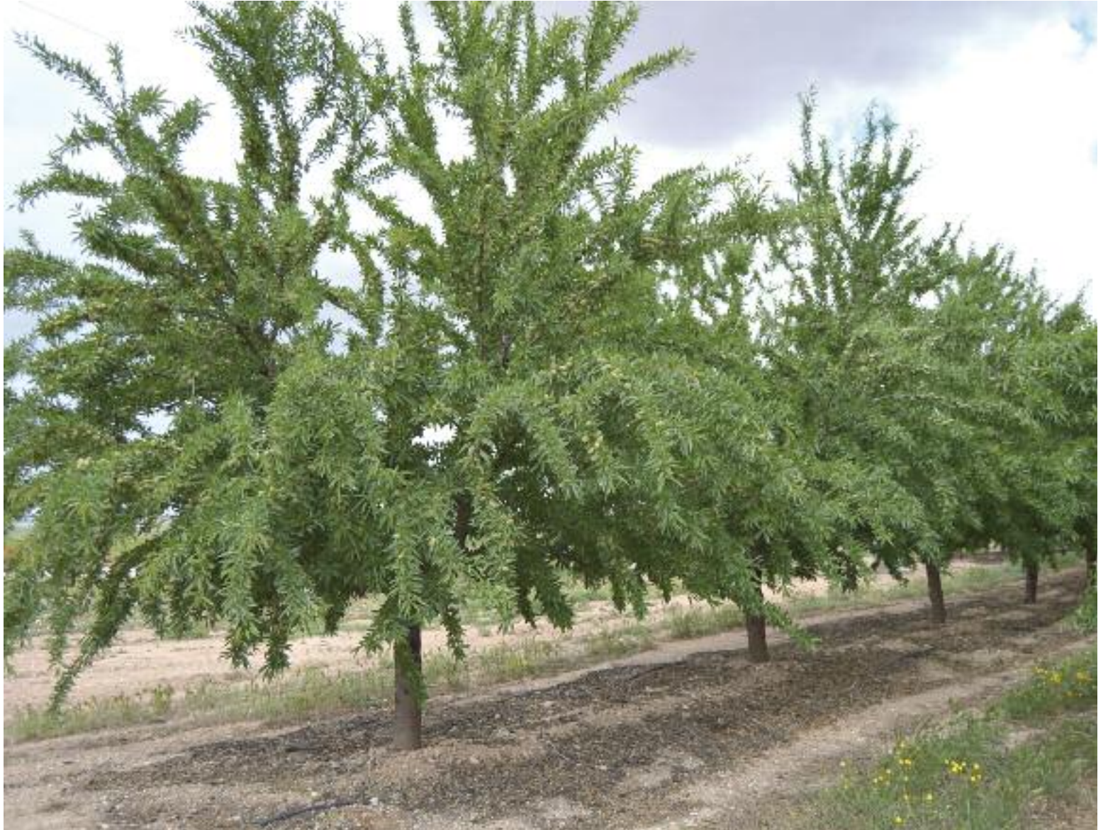
Almendo de alta producción en regadío

No obstante, como señaló Sauras, "nuestra gama de productos abarcan no sólo Renovation fuerza, que es la base inicial para comenzar con el plan de fertilización, sino que se completa con correctores y estimulantes foliares y radiculares con los que realizamos los aportes extras necesarios en floración, cuajado, etc", comentó el res-