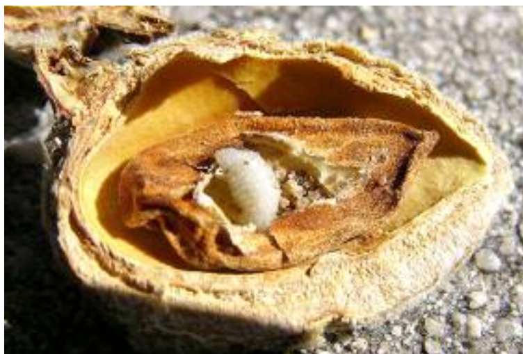
Larva de avispiña que ha acabado con el gallo de la almendra