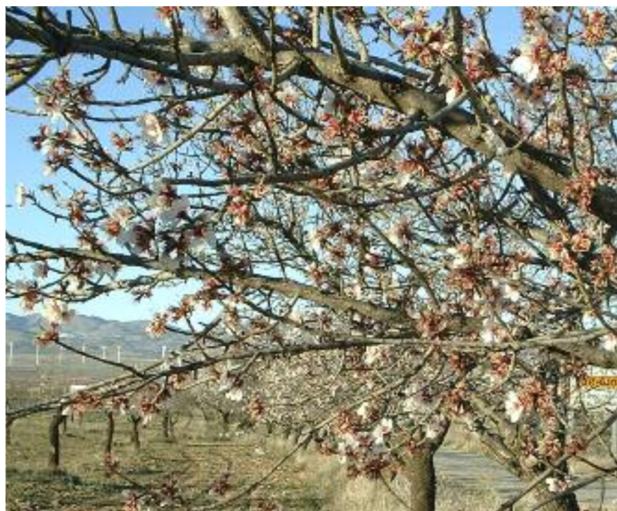
Es difícil distinguir una rama de almendras amargas en el árbol