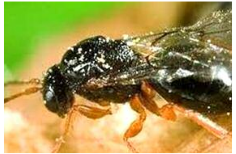
Ejemplar adulto de la avispiña del almendro

co. La larva completará su desarrollo y pasará a la fase de pupa, para nacer a finales del invierno siguiente. La vida de este insecto en el exterior de la almendra es muy breve. Después de nacer, se aparean rápidamente y en unos días ya han vuelto a poner huevos, de ahí que el agricultor ha de estar atento para detectar cuándo hay ejemplares adultos en los campos, único momento en el que se puede tratar.