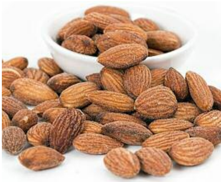
Almendras en gallo

Hoy día, en partidas con un contenido del 1% (o incluso menor) de almendra amarga se producen problemas de rechazo del producto en los mercados internacionales, como el norteamericano o el asiático. Además, el consumidor nacional cada vez se muestra más re-