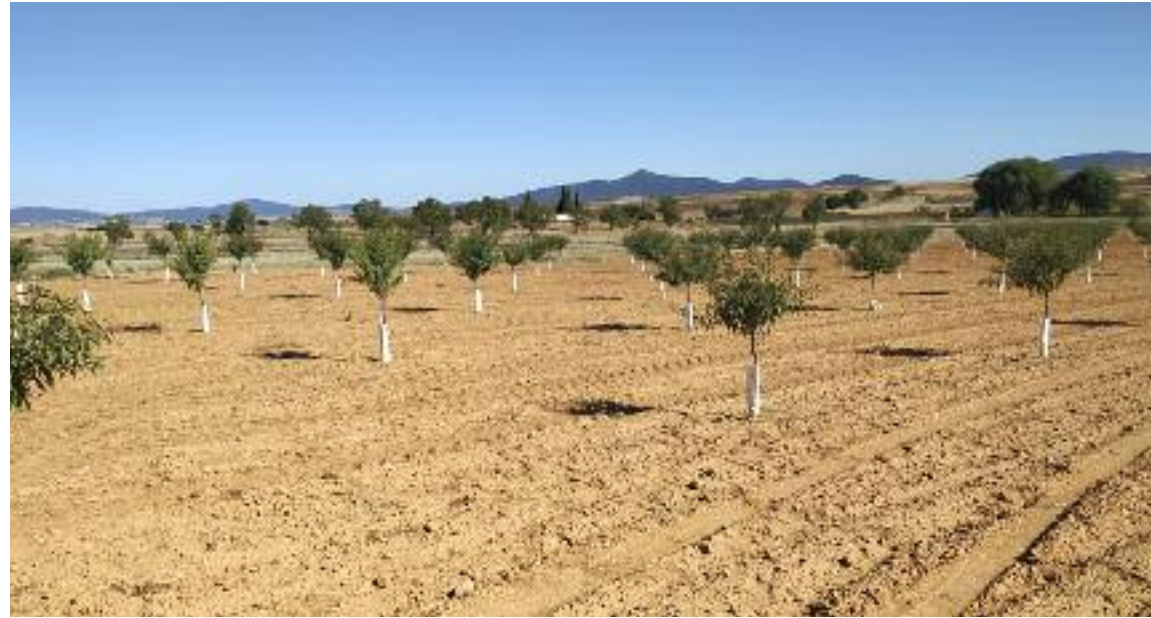
Plantación de almendro en la zona alta de Teruel

Mejora varietal del almendro y sus posibilidades a mayor altitud